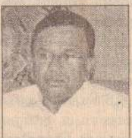
கிளிநொச்சியில் நேற்று முன்தினம் விடியூக்