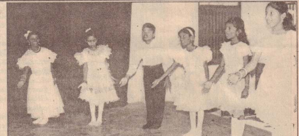
தொல்புரம் வீகனேஸ்வரா வித்தியாலயத்தில் அண்மையில் நடைபெற்ற பெற்றோர் தின விழாவின் போது பாடசாலை மாணவர்கள் வழங்கிய கலை நிகழ்வைப் படத்தில் காணலாம் (50-119)