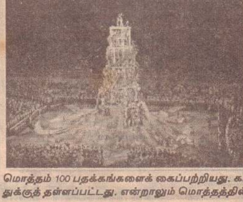
மொத்தம் 100 பதக்கங்களைக் கைப்பற்றியது. கடந்த போட்டியில் முதலிடத்தைப் பிடித்த அமெரிக்கா, இம்முறை இரண்டாம் இடத்துக்குத் தள்ளப்பட்டது. என்றாலும் மொத்தத்தில் அமெரிக்காவுக்கே முதலிடம். 38 தங்கம் உட்பட 110 பதக்கங்களைப் பெற்றது.

அக்கொடியை வழங்கினார். நிகழ்ச்சியில் சீன அதிபர் ஹூ ஜிந்தாவோ, பிரிட்டிஷ் பிரதமர் கார்டன் பிரவுன், சர்வதேச ஒலிம்பிக் குழுவின் தலைவர் ஜாக் குவில் ரோஜ், கௌரவத் தலைவர் ஜிவன் ஆண்டானியோ சமராஞ்ச், பிரபல கால்பந்து வீரர் டேவிட் பெக்காம் உள்பிட்ட பலர் கலந்துகொண்டனர். கடந்த 8 ஆம் திகதி முதல் நடைபெற்று வந்த இப்போட்டியில் 204 நாடுகள் பங்கேற்றன. 302 பிரிவுகளில் போட்டிகள் நடைபெற்றன. அமெரிக்க ரீச்சல் வீரர் மைக்கல் பெல்பில், ஜமெய்க்கா தடகள வீரர் உசைன் போல்ட் ஆகியோர் இந்த ஒலிம்பிக்கில் மின்னிய நட்சத்திரங்களில் முக்கிய இடத்தைப் பிடித்தனர். பெல்பில் 8 தங்கப் பதக்கங்களையும், போல்ட் 3 தங்கப் பதக்கங்களையும் கைப்பற்றினார். அனைத்தையும் சாதனைகளுடன் அவர்கள் பெற்றது குறிப்பிடத்தக்கது. சீனா முதலிடம் அதிகபட்சமாக 639 வீரர், வீராங்கனைகளை களத்தில் இறக்கிய சீனா, பதக்கப் பட்டியலில் முதலிடத்தைப் பிடித்தது. 51 தங்கம், 21 வெள்ளி, 28 வெண்கலம் என மொத்தம் 100 பதக்கங்களைக் கைப்பற்றியது. கடந்த போட்டியில் முதலிடத்தைப் பிடித்த அமெரிக்கா, இம்முறை இரண்டாம் இடத்துக்குத் தள்ளப்பட்டது. என்றாலும் மொத்தத்தில் அமெரிக்காவுக்கே முதலிடம். 38 தங்கம் உட்பட 110 பதக்கங்களைப் பெற்றது.