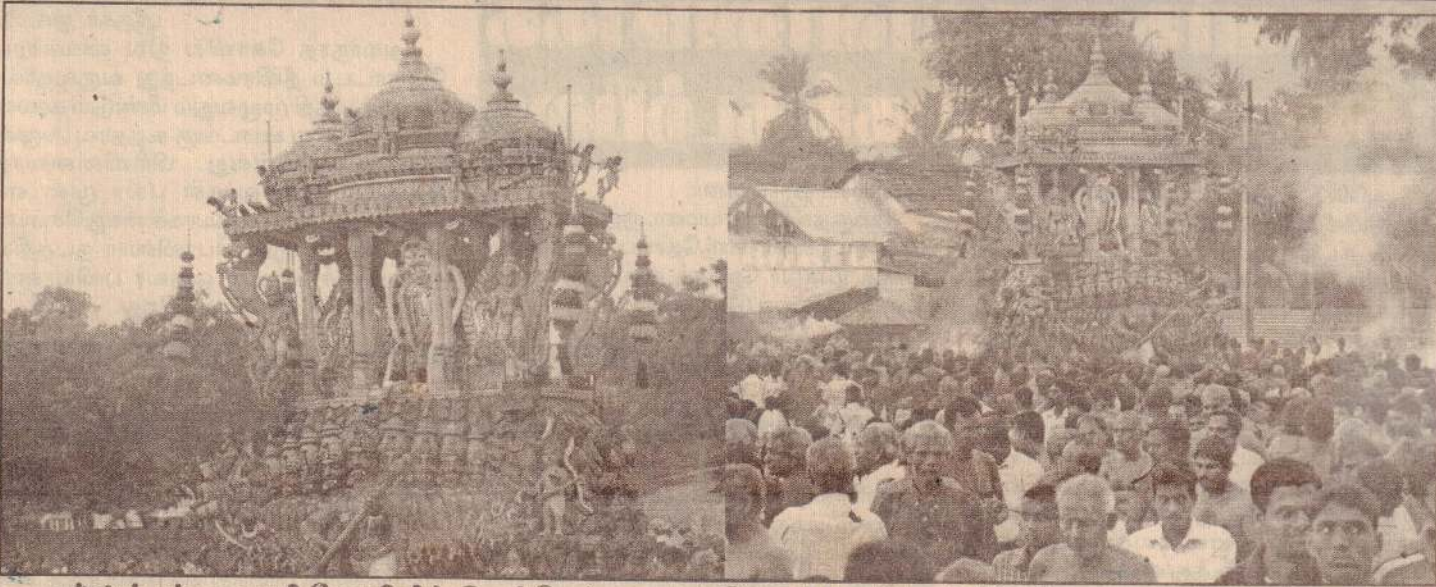
நல்லூர் கந்தசுவாமி கோயிலில் இடம்பெற்று வரும் பெருந்திருவிழாவில் நேற்று கைலாசவாகனத்திருவிழா இடம்பெற்றது. முருகப்பெருமான் வள்ளிதெய்வானை சமேதராக கைலாசவாகனத்தில் வீதி வலம் வந்து பக்தர்களுக்கு அருட்காட்சி அளிப்பதையும் திருவிழாவில் கூடியிருந்த பக்தர்களையும் படங்களில் காணலாம்.