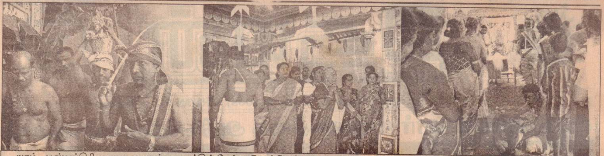
யாழ். ஆஸ்பத்திரி ஞானவைரவர் ஆலயத்தில் நேற்று இடம்பெற்ற கும்பாபிஷேகத்தின் காட்சிகள் இவை.