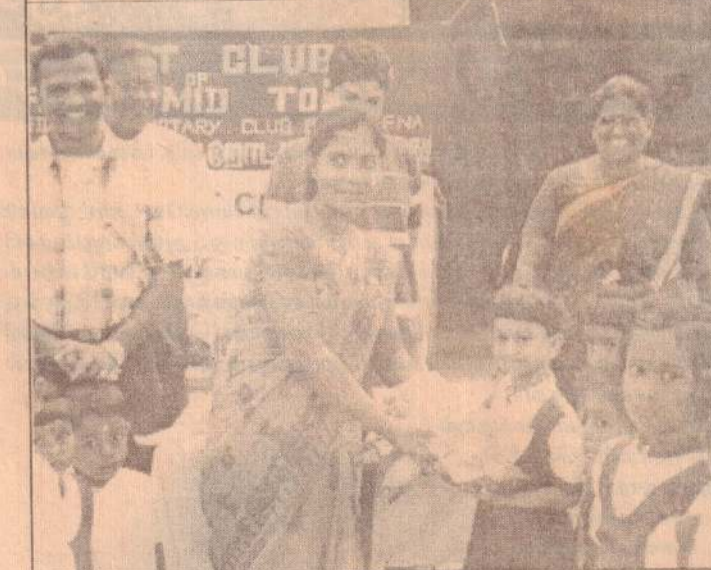
யாழ்ப்ப.நகர்மைய நோட்டரக்ட் கழகம் உடுவில் இளைஞர்மன்ற முன்பள்ளிக்கு தளபாடங்களை வழங்கியுள்ளது. முன்பள்ளி மாணவர்களிடம் உபகரணங்கள் வழங்கப்படுவதையும் நோட்டரிக்கழகத் தலைவர், செயலாளர், பொருளாளர் ஆகியோரையும் படத்தில் காணலாம்.