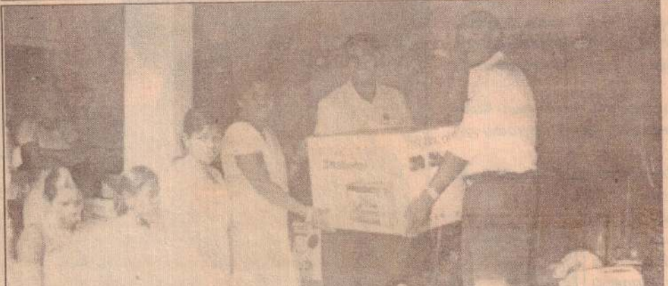
ஜி.சி.நி. நிறுவனத்தின் அனுசரணையுடன் கோப்பாய்ப் பிரதேச செயலகத்தால் "விதாதா" வள நிலையத்தில் நடத்தப்பட்ட பயிற்சி நெறியில் பங்குபற்றிய பயனாளிகளுக்கு தொழில்நுட்ப உபகரணங்கள் வழங்கும் நிகழ்வு அண்மையில் நடைபெற்றது. நிகழ்வில் பிரதம விருந்தினர் சீ.ஏ.மோகன்ராஸ் பயனாளி ஒருவருக்கு உபகரணம் வழங்குவதைப் படத்தில் காணலாம்.