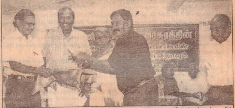
இலங்கை, இந்திய எழுத்தாளர்களின் 60 நூல்கள் மணிமேகலைப் பிரசுரத்தால் அண்மையில் கொழும்பு தமிழ்ச் சங்கத்தில் வெளியிட்டு வைக்கப்பட்டது. நிகழ்வில் மட்டக்களப்பு மாவட்ட நாடாளுமன்ற உறுப்பினர் செல்வி சுதங்கேஸ்வரியின் 3 நூல்களை எழுத்தாளர் செங்கை ஆழியாணி மிருந்து யாழ்ப்ப. மாவட்ட நாடாளுமன்ற உறுப்பினர் சொல்மன் கு.சிறில் பெற்றுக்கொள்வதைப் படத்தில் காணலாம். நூலாசிரியர், மணிமேகலைப் பிரசுர இயக்குனர் ரவி தமிழ்வாணன், மட்டக்களப்பு நாடாளுமன்ற உறுப்பினர் கனகசபை ஆகியோரும் படத்தில் உள்ளனர்.