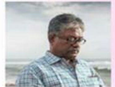
கவிஞர், எழுத்தாளர், பாடகர், துணைப்பல இயக்குனர் ரவி சுப்பிரமணியன்