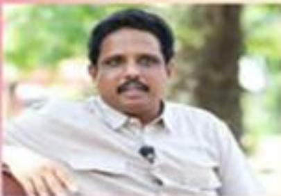
மதுரை நாடாளுமன்ற உறுப்பினர், சாகித்திய அக்கடமி விருது பெற்ற எழுத்தாளர் வீர யுக நாயகன் வேள்பாரி நாவலாசிரியர் சு.வெங்கடேசன்

தமிழ் இலக்கியத் தோட்டத்தின் வருடாந்த விருது வழங்கும் விழா, இந்த வருடம் மெய்நிகர் வழியாக நடைபெறவுள்ளது. முதன்மை விருந்தினர்கள்