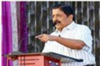
பிரபல நடிகர், ஓயிவர், எழுத்தாளர், பேச்சாளர் சிவகுமார்