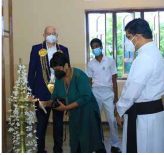
களுக்கு வழங்கி வரும் ஊக்கத்துக்கு நன்றி கூறி சர்வதேச ரீதியிலான ஒத்துழைப்பையும் வாழ்த்தி நின்றார்.