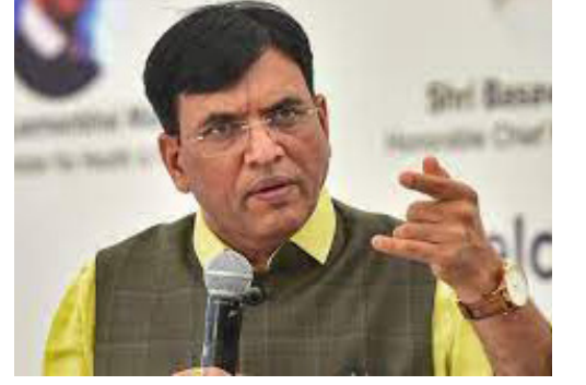
தடுப்பூசியைப் பெற்றோம். அதுபோலவே, ஏனைய முடிவுகளும் அறிவியல், மருத்துவத் துறையினரின் ஆலோசனைகளின்படி எடுக்கப்படும். என்று அவர் தெரிவித்துள்ளார்.

தொற்றுநோயின் தொடக்கத்தில் மருத்துவ உள்கட்டமைப்பை வலுப்படுத்தினோம். கடந்த 2 ஆண்டுகளில் துணிச்சலான முடிவுகள் எடுக்கப்பட்டன. ஒருவர் தடுப்பூசி கண்டு பிடிப்பது பற்றி ஆராய்ச்சி செய்தால் அதற்கு ஒப்புதல் பெற 3 வருடங்களாகும். நாங்கள் அந்த விதிகளை அகற்றினோம். ஆராய்ச்சிக்குப் பிறகு ஒரு வருடத்திற்குள்