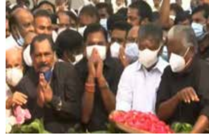
ஜெயலலிதா உடல்நலக்குறைவால் பாதிக்கப்பட்டு கடந்த 2016 ஆம் ஆண்டு செப்ரெம்பர் 23 ஆம் திகதி சென்னையில் உள்ள அப்போலோ மருத்துவமனையில் சேர்க்கப்பட்டார்.

சென்னை, டி.செ 06 தமிழக முன்னாள் முதலமைச்சர் ஜெயலலிதாவின் ஐந்தாவது நினைவிடத்தை முன்னிட்டு அவரது நினைவிடத்தில் நேற்று ஓ.பி.எஸ்., ஈ.பி.எஸ். மலர்தூவி மரியாதை செலுத்தினர். அங்கு அவர்கள், “அம்மா உணவகம், அம்மா மருந்தகம் திட்டங்களை நிறுத்துவோரின் கொட்டங்கள் அடக்கப்படும், நீட் தேர்வு இரத்து, கல்விக்கடன் ரத்து என்று பொய் வாக்குறுதியளித்த முதலமைச்சர், இனியும் தமிழர்களை ஏமாற்ற விடமாட்டோம்” என்று உறுதிமொழி எடுத்தனர். தமிழக அரசியலில் இரும்பு பெண்மணியாக உலா வந்த மறைந்த முதலமைச்சர்