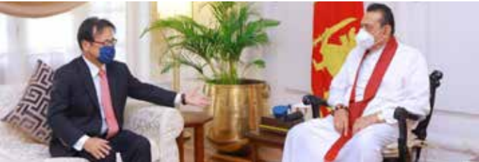
இலங்கையில் பயிற்சிபெற்ற பணியாளர்களைப் பணியில் ஈடுபடுத்துவதற்கு ஜப்பான் அரசு ஆர்வமாக உள்ளது