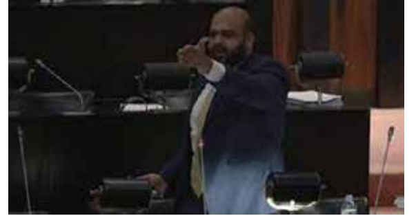
ரத்தை வளர்க்கவும் நாட்டின் பிரச்சினைகளைத் தீர்க்கவும் இணைந்து செயற்படத் தயார் என்பதையே கூற விரும்புகிறோம். - எனக் குறிப்பிட்டுள்ளார்.

பெளத்த அடிப்படைவாதம் தலைதூக்கியுள்ளது என்பதையும் நான் கூறிக்கொள்ள விரும்புகிறேன். கிழக்கு மக்கள் அனைவரும் இந்த செயலணிக்கு எதிர்ப்பினை வெளியிட்டுள்ளார்கள். ஒரே நாடு - ஒரே சட்டம் என்பதை வைத்து நாட்டை ஒருபோதும் முன்னோக்கிக் கொண்டு செல்ல முடியாது என்பதை அனைவரும் புரிந்துகொள்ள வேண்டும். நாம் இந்த அரசாங்கத்தை கவிழ்க்க வேண்டுமென்றோ, ஆட்சியைக் கைப்பற்ற வேண்டுமென்றோ ஒருபோதும் நினைக்கவில்லை. மாறாக பொருளாதா