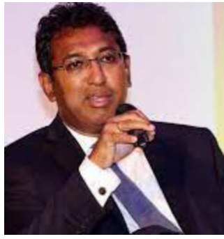
கொள்வதற்கான காலம் கடந்து விட்டது எனவும் அவர் குறிப்பிட்டுள்ளார்.

வேற்று மாற்று வழிகள் எதுவும் இல்லை எனவும், உள்நாட்டு ரீதியான தீர்வுத் திட்டமொன்றை பெற்றுக்