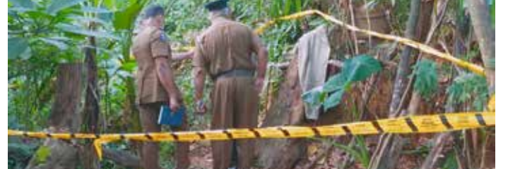
மின்சார வேலியில் சிக்கி இரு பிள்ளைகளின் தாய் உயிரிழந்துள்ளார். தலவாக்கலை