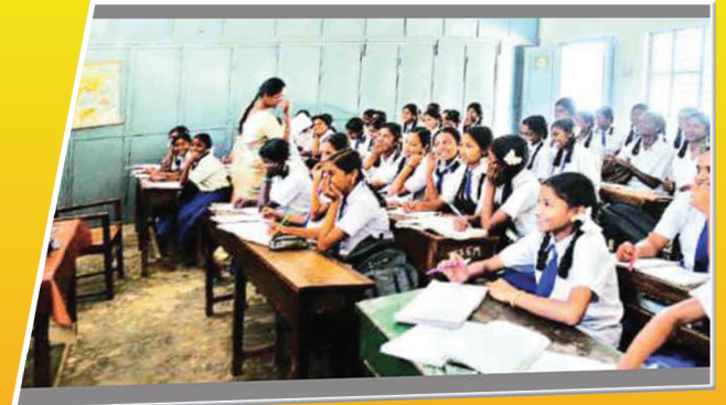
ஆசிரியர் முன்பேற வேண்டும்