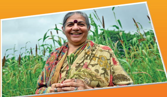
பெருந்தொற்று என்பது எமது வாழ்வியலுக்கு எதிரான போரின் விளைவு