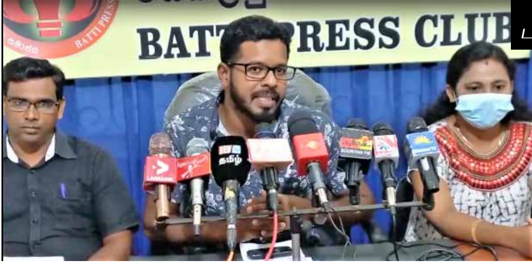
மட்டக்களப்பு மாவட்ட பயிற்சி பட்டதாரி ஆசிரியர் சங்கத்தினர் கவலை

அண்மையில் இடம்பெற்ற அதிபர், ஆசிரியர்கள் சம்பள முரண்பாட்டின் போது பட்டதாரி பயிலுனர் ஆசிரியர்கள் பகடைக்காய்களாகப் பயன்படுத்தப்பட்டார்கள். இவ்வாறு தங்களின் சந்தர்ப்பத்திற்கு பட்டதாரிகளைப் பயன்படுத்திவிட்டு தற்போது அபிவிருத்தி உத்தியோகத்தர் நியமனம் வழங்கப்படப்போகின்றது என்று சொல்வது எந்த விதத்தில் நியாயம் என மட்டக்களப்பு மாவட்ட பயிற்சி பட்டதாரி ஆசிரியர் சங்கத்தினர் தெரிவித்தனர்.