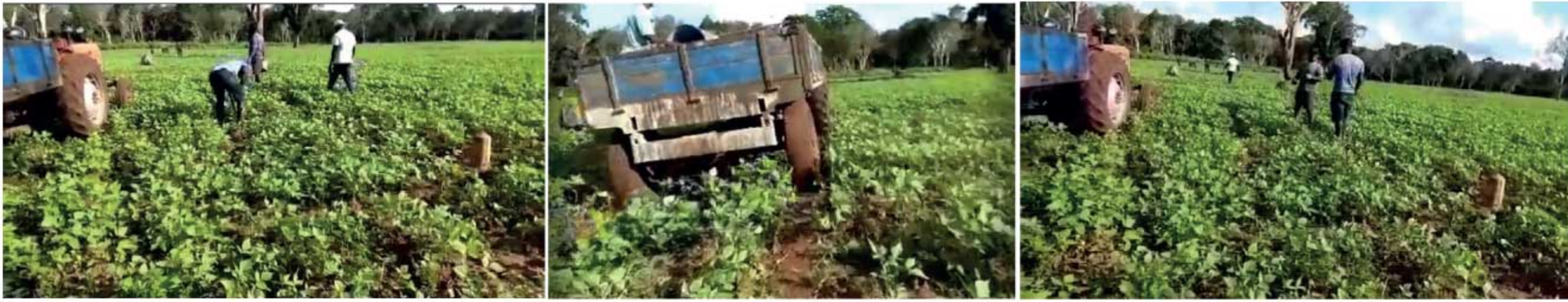
வவுனியாவில் வனவளத் திணைக்களத்தினர்