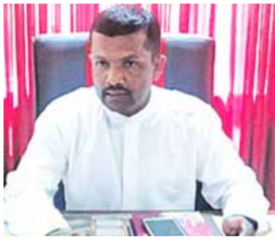
ரகச்செயற்பாடாக இருப்பதுடன் இந்நாட்டில் வாழுகின்ற தமிழ்மக்களையும் சிங்கள மக்களுக்கும் இடையில் மீண்டும் ஒரு குழப்பத்தினை ஏற்படுத்துவதற்கான செயலாகவே இதனைப் பார்க்கக்கூடியதாக இருக்கின்றது இவர்களுக்கு இடையில்

இன்று அந்த இடத்தில் புத்தர்சிலையினை வைத்து இருக்கின்றார்கள் இந்நாட்டில் புத்தர்சிலை வைப்பதற்கான செயலாகவே இதனைப் பார்க்கக்கூடியதாக இருக்கின்றது இவர்களுக்கு இடையில்