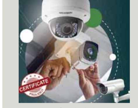
(லபாலிவோரியன் நிருபர் எம்.எஸ்.எம்.ஸாகீர்)

தொழில் வாய்ப்பை எதிர்பார்த்துக் கொண்டிருக்கும் அம்பாறை மாவட்டத்தைச் சேர்ந்த இளைஞர்களுக்கு ஐக்கிய இளைஞர் சக்தி நடாத்தும் மாடுபெரும் இலவச CCTV Camera Installation ஒருநாள் இலவச பயிற்சி நெறி (15) புதன்கிழமை கல்முனை பரடைஸ் வரவேற்பு மண்டபத்தில் இடம் பெறவுள்ளது.