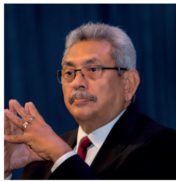
மேலதிக பரிசோதனைகளை செய்துகொள்வதற்கே ஜனாதிபதி, சிங்கப்பூருக்குப் பயணமாகியுள்ளார் என்றும் தகவல்கள் தெரிவிக்கின்றன.

இந்நிலையில், ஏற்கனவே, பெற்றுக்கொண்ட மருத்துவ சிகிச்சை தொடர்பிலான