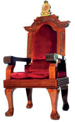
முன்வைப்பதற்கான வாய்ப்பு உள்ளது.

ஒன்பதாவது பாராளுமன்றத்தின் இரண்டாவது கூட்டத்தொடர் 2022 ஜனவரி 18ஆம் திகதி மு.ப 10.00 மணிக்கு ஆரம்பிக்கப்பட இருப்பதாக பாராளுமன்ற தொடர்பாடல் அலுவலகம் அறிவித்துள்ளது. புதிய கூட்டத்தொடர் ஆரம்பிக்கும்போது, பாராளுமன்றத்தை வைபவரீதியாக ஜனாதிபதி ஆரம்பித்துவைத்து, அக்கிராசனத்தை ஏற்று, அரசாங்கத்தின் கொள்கைப் பிரகடனத்தை