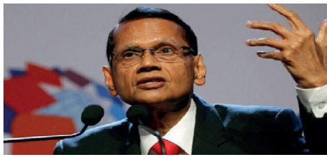
ஜனாதிபதிக்கு வழங்கப்பட்டுள்ள அதிகாரமாகும் என்றார் தொடர்ச்சி P2

பாராளுமன்ற கூட்டத்தொடரை நேற்று முன்தினம் (12) நள்ளிரவுடன் ஒத்திவைப்பது தொடர்பில் ஜனாதிபதியால் வெளியிடப்பட்ட தீர்மானம், அவசர தீர்மானம் இல்லையெனத் தெரிவித்த வெளிவிவகார அமைச்சர் ஜி. எஸ். பிரிஸ், இலங்கையின் சகல ஜனாதிபதிகளும் அந்த அதிகாரத்தை பயன்படுத்தியுள்ளனர் என்றும் அது அரசியலமைப்பு ஊடாக நேரடியாகவே