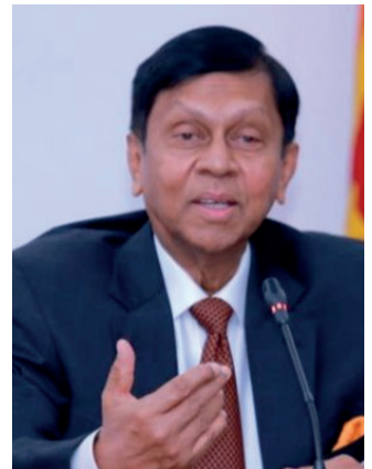
என ஆளுநர் தனது டுவிட்டர் பக்கத்தில், நேற்று (13) பதிவிட்டுள்ளார்.

இந்த வாரம் நடைபெறவுள்ள (நேற்று) அமைச்சரவைக் கூட்டத்துக்கு தான் அழைக்கப்பட்டதாக வெளியான செய்திகளை இலங்கை மத்திய வங்கியின் ஆளுநர் அஜித் நிவாட் கப்பிரால் மறுத்துள்ளார். சர்வதேச நாணய நிதியத்திடம் உதவி பெறுவது தொடர்பில் விவாதிக்க அமைச்சரவை தன்னை அழைத்ததாக, எதிர்க்கட்சி அரசியல்வாதி ஒருவரை மேற்கோள் காட்டி ஊடகங்களில் வெளியான செய்திகள் பொய்யானவை