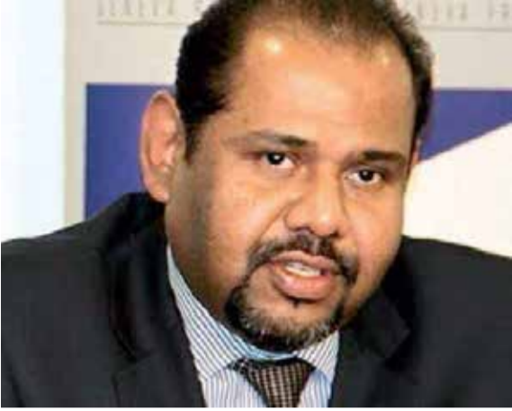
ஒற்றையாட்சி அரசமைப்புக்குள்ளே தமிழ் மக்களுக்கு ஒருபோதும் தீர்வு கிடைக்காது என்ற நிலைப்பாட்டில் தாங்கள் மிகத் தெளிவாக இருக்கிறோம் என நாடாளுமன்ற உறுப்பினர் கஜேந்திரகுமார் பொன்னம்பலம்

தமிழ்க் கட்சிகளின் கூட்டத்தை புறக்கணித்த காரணம் இதுவே!