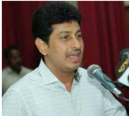
நாட்டிலே ஜனநாயகம் இல்லை. அராஜக ஆட்சியை முன்னெடுப்பதற்கான முனைப்புகளே இடம்பெறுகின்றன. மக்கள் பிரதிநிதிகளுக்குக் கூடப் பாதுகாப்பு இல்லை என தொழிலாளர் தேசிய சங்