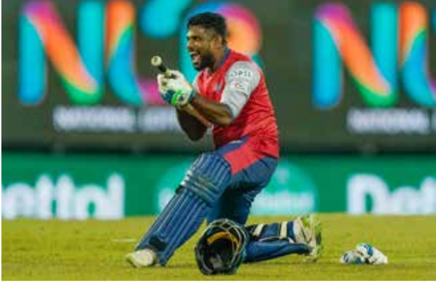
எல். பி. எல். இருபது - 20