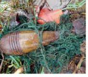
இதனையடுத்து அம் மீனவரால் சம்பூர் கட்பைபுறியினருக்கு வழங்கப்பட்ட கட்பைபுறிச்சாலில் இரால் பாத்திலிருந்து வெடிக்காத நிலையில் காணப்பட்ட 60 மீட்டர் மீட்டர் ரகம் கொண்டு யோட்டார் குண்டி மீயு தெறு (15) துண்டிமழை காலம் மீட்கப்பட்டன.

திருகோணமலை, சம்பூர் பொலில் பிரிவுக்குட்பட்ட கட்பைபுறிச்சாலில் இரால் பாத்திலிருந்து வெடிக்காத நிலையில் காணப்பட்ட 60 மீட்டர் மீட்டர் ரகம் கொண்டு யோட்டார் குண்டி மீயு தெறு (15) துண்டிமழை காலம் மீட்கப்பட்டன.