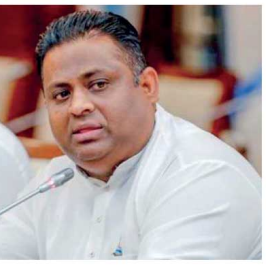
வேண்டுமெனக் கேட்டுக்கொண்டார். தேசிய தொழிற்துறையை இலக்காகக் கொண்டு வந்தால், மின்லாது நாட்டை எழுது முயற்சியும் உருவாக்க முடியாதுபோனாலும், எதிர்காலத்தில் உருவாகும் எழுது முயற்சியைக்கொண்டிட்டுச் செல்ல வேண்டும் எனவும் தெரிவித்தார்.

66 தேசிய தொழிற்துறையை சிலைக்காகக் கொண்டு வந்தால், மின்லாது நாட்டை எழுது முயற்சியும் உருவாக்க முடியாதுபோனாலும், எதிர்காலத்தில் உருவாகும் எழுது முயற்சியைக்கொண்டிட்டுச் செல்ல வேண்டும்