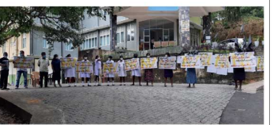
கோலே, ரல்ல ஆழ்ந்த வலத்தியாலையில் கலில், ஊழியர்கள் 7500 உயும் பெருப்பணை வரத வேண்டுமென்று கோரின உட்பு பெரிக்களை முனைத்து தெறு (15) தெறுப் போட்டத்தில் ஈடுபட்டார்கள்.