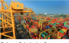
செய்த ஆயிரத்துக்கும் அதிகமான கொள்கலன்களே இவ்வாறு கொழும்பு துறைமுகத்தில் தேக்கிக் கிடக்கின்றன. இதற்கு முன்னரும் இப்பொருட்கள் துறைமுகத்தில் தேக்கிக் கிடந்த நிலையில் அவற்றை உடனடியாக விடுவிக்க வேண்டும் என பிரதமர் மஹிந்த ராஜபக்ஷ ஆலோசனை வழங்கியிருந்தார்.

அத்தியாவசிய பொருட்களை ஏற்றிவந்த 1,500 இடங்களை மேற்பட்ட கொள்கலன்கள் கொழும்பு துறைமுகத்தில் தேக்கிக் கிடப்பதாகத் தெரிவிக்கும் அத்தியாவசிய பொருட்களை இறக்குமதி செய்வோரின் சங்கம், இந்தக் கொள்கலன்களை துறைமுகத்திலிருந்து விடுதலாக்கவதற்கும் காலதாமதம் ஏற்பட்டு வருவதாகவும் தெரிவிக்கின்றது.