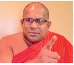
கைது செய்யப்போவதாக பொய்கறியே அரசாங்கம் ஆட்சியை வைப்பற்றியது. ஆனால் ஆட்சிக்கு வந்தவுடன் தான்தோன்றித்தனமாக செயற்படுகிறார்கள்.

1953ஆம் ஆண்டுக் காலப் பகுதிக்கு நாடு திரும்பியன்தாசுத் தெரிவிக்கும் தேவலேஷித்த அஜித தேரர், இன்னும் ஓரிகு மாதங்களில் நாடு வங்குரோத்து நிலைமைக்கு செல்லும் எனவும் எச்சரித்தார்.