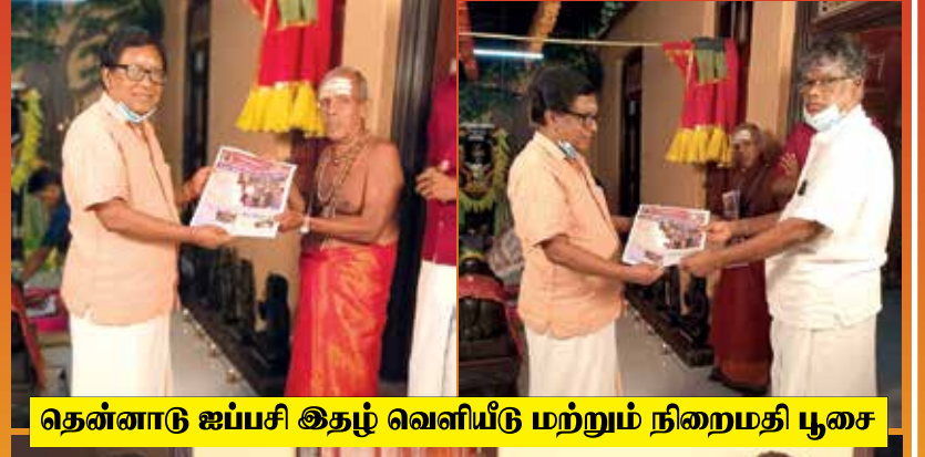
தென்னாடு ஐப்பசி இதழ் வெளியீடு மற்றும் நிறைமதி பூசை