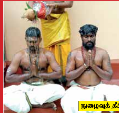
நுழைவுத் தீக்கை (ஊப்பசி 8)