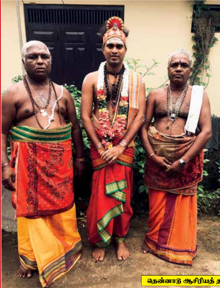
தென்னாடு ஆசிரியத் திருமுழுக்கு (ஊப்பசி 28)