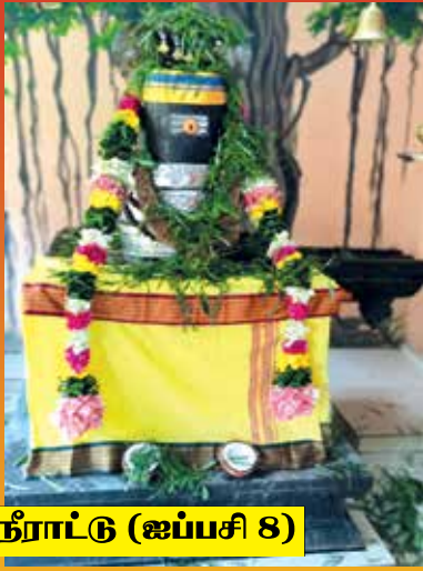
ஐம்பூதநாதருக்கு சங்கு நீராட்டு (ஐப்பசி 8)