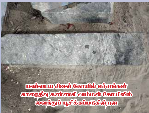
பண்டைய சிவன் கோயில் எச்சங்கள் காரைதீவு கண்ணகி அம்மன் கோயிலில் வைத்துப் பூசிக்கப்படுகின்றன