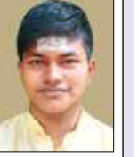
சிவத்திரு யாழுவன் சிவவேதன்

கந்தன் கவின் அறுமைப் பெருநாள் என்பது முருகக்கடவுள் சூரனை அழித்த பெருமையை சைவ சமயத்தவர்கள் கொண்டாடும் ஒரு விழாவாகும். இது விரதமாகவும் விழாவாகவும் சைவர்கள் மத்தியில் கடைப்பிடிக்கப்படுகின்றது. அறுமை என்பது ஆறு நாட்களைக் குறிக்கின்றது. ஐப்பசித் திங்கள் மறைமதிக்கு அடுத்த நாள் முதல் அறுமைப் பிறைநாள் ஈறாக உள்ள ஆறு நாட்களும் கந்தன் கவின் அறுமைக் காலமாகும். இந்த ஆறு நாட்களையும் சைவர்கள் விரத நாட்களாகக் கருதி வழிபாடு இயற்றுகின்றனர். முருகப்பெருமான் சைவத்தமிழர்களால் தொன்று தொட்டு வழிபடப்படும் கடவுளாகத் திகழ்கின்றார்.