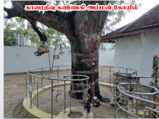
காரைதீவு கண்ணகி அம்மன் கோயில்

"இந்த வடிவம் பழந்தமிழகத்து நடுகற்கள், வீரக்கற்கள் என்பனவற்றை நினைவுறுத்துகின்றது. பழந்தமிழ் நூல்களான எட்டுத்தொகை, பத்துப்பாட்டு என்பனவற்றில் அவற்றைப் பற்றிய குறிப்புகள் வருகின்றன. ஆயினும் அங்கு நடைபெற்ற அகழ்வாராய்வுகளில் காரைதீவிற்கு கிடைப்பதைப் போன்ற