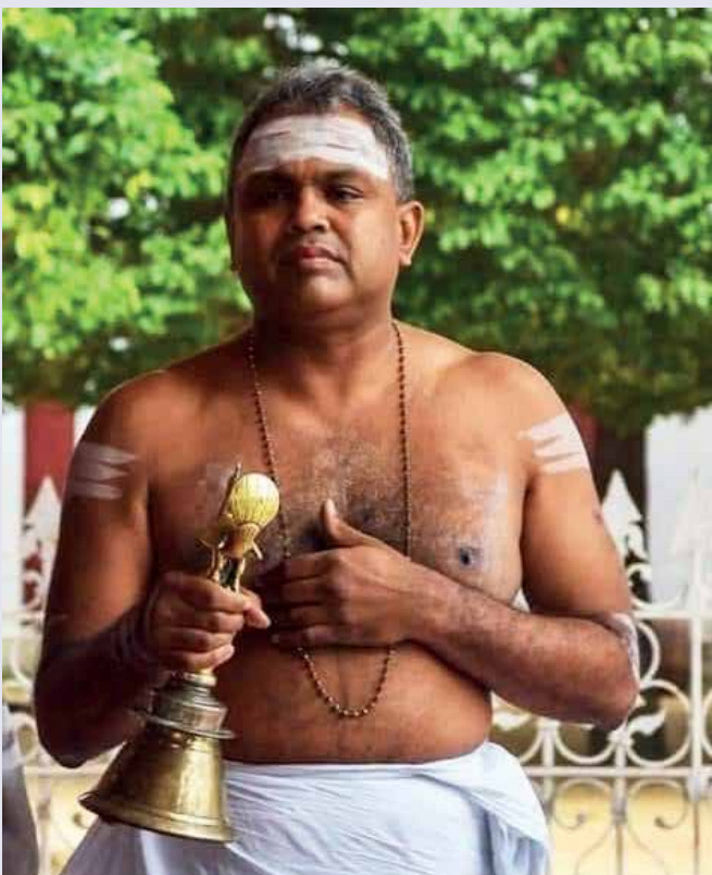
திருக்கோபுரம் ஒன்றினை அமைக்க அடிக்கல் நாட்டியுள்ளார்.