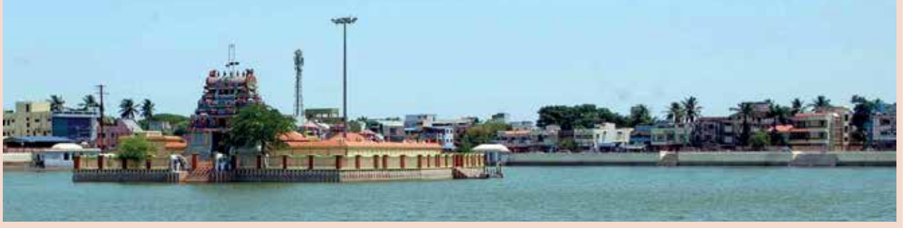
போற்றும் நிலைமை புரிந்த அமரர் சேனும் அறிய அரிய திருத்தொண்டின் செறியச் சிறந்து உள்ளார்”

முகத்தில் கண்கள் இருந்தால் மட்டும் போதாது. அகத்தில் கண்கள் இருக்க வேண்டும். வெறும் புறப்பார்வை மட்டும்