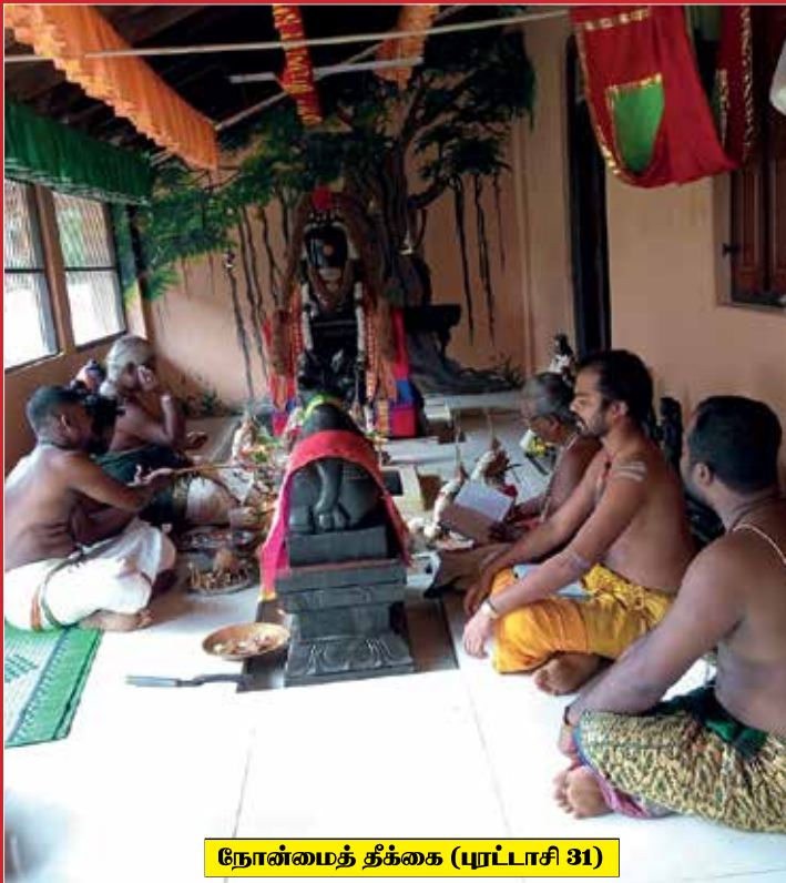
நோன்மைத் தீக்கை (பூர்ப்பாசி 31)