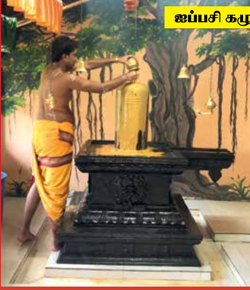
ஐப்பசி கழுவாய் வழிபாடு (ஐப் 16)