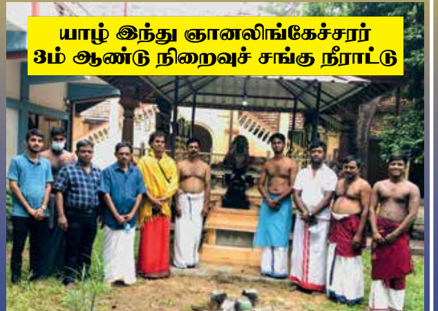
யாழ் இந்து ஞானலிங்கேச்சரர் 3ம் ஆண்டு நிறைவுச் சங்கு நீராட்டு