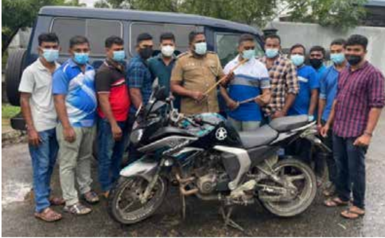
குண்டுத் தாக்குதலையும் மேற்கொண்டிருந்தது.

வீட்டுக்குள் கடந்த புதன் கிழமை புகுந்த சும்பல் பெறு மதியான பொருள்களைச் சேதப் படுத்தியதுடன் பெற்றோல்