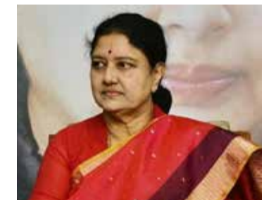
பத்திரிகை தாக்கல் செய்ய ஊழல் தடுப்பு படைக்கு உத்தரவிடுமாறு கோரியிருந்தார். தலைமை நீதிபதி அமர்வு வழக்கின் விசாரணையை 2 வாரத்திற்கு ஒத்தி வைத்தது. ஒருவேளை இரண்டு வாரத்தில் குற்றப்பத்திரிகை தாக்கல் செய்யப்பட்டாவிட்டால் உந்துறை செயலாளர் நேரில் ஆஜராக வேண்டும் என்றும் உத்தரவிட்டது.