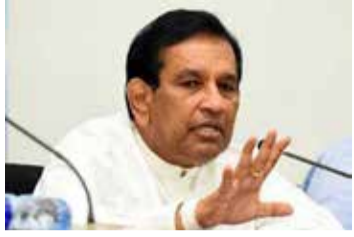
ஊடகவியலாளர் சந்திப்பில் கலந்துகொண்டு உரையாற்றுகையிலேயே அவர் இவ்வாறு கூறினார். இது தொடர்பில் அவர்

கொழும்பு, டிசெ. 18 நாட்டில் 32 வகையான அத்தியாவசிய மருந்துகளுக்கு தட்டுப்பாடு ஏற்பட்டுள்ளது எனவும், விஷப் பாம்பு தீண்டினால் ஏற்படும் ஊசி மருந்துகூட இல்லை எனவும் ஐக்கிய மக்கள் சக்தியின் பாராளுமன்ற உறுப்பினரும் முன்னாள் சுகாதார அமைச்சருமான ராஜித சேனாரத்ன தெரிவித்தார். எதிர்க்கட்சித் தலைவர் அலுவலகத்தில் நடைபெற்ற