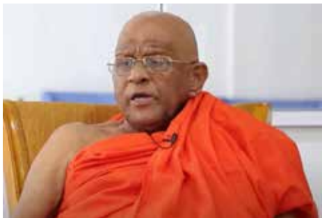
நேற்று ஆரம்பமான கொழும்பு பல்கலைக்கழகத்தின் பட்டமளிப்பு விழா இன்றும், நாளையும் தொடர்ந்து இடம் பெறவுள்ளமை குறிப்பிடத்தக்கது. (ஐ)

இதன்போது, அவர்களிடமிருந்து போதைப்பொருள், ஆயுதங்கள் மற்றும் வெடிமருந்துகள் கைப்பற்றப்பட்டன என்பது குறிப்பிடத்தக்கது. (அ)