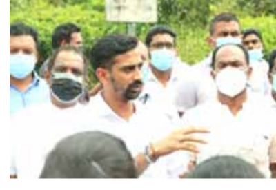
போராட்டத்தில் ஈடுபட்டு வந்தனர். நிர்வாகங்களின் கெடுபிடிகளுக்கு எதிராகவும், தமது தொழில் உரிமைகளை பாதுகாக்கப்பட வேண்டும்

தொண்டமான் திட்டவாட்டமாக அறிவித்துள்ளார். அக்கரபத்தனை பிளாண்டேசனாவுக்குட்பட்ட தோட்டங்களில் வேலை செய்யும் தொழிலாளர்கள், இன்று (20.12.2021) திங்கட்கிழமை முதல் பணிக்கு திரும்புவார்கள் எனவும், நிர்வாகத்திடமிருந்து எழுத்து மூல உத்தரவாதம் கோரப்பட்டுள்ளதாகவும் ஜீவன் தொண்டமான் தெரிவித்தார். அக்கரபத்தனை பிளாண்டேசனாவுக்குட்பட்ட தோட்டங்களில் வேலை செய்யும் தொழிலாளர்கள் கடந்த 5 நாட்களாக பணி புறக்கணிப்பு