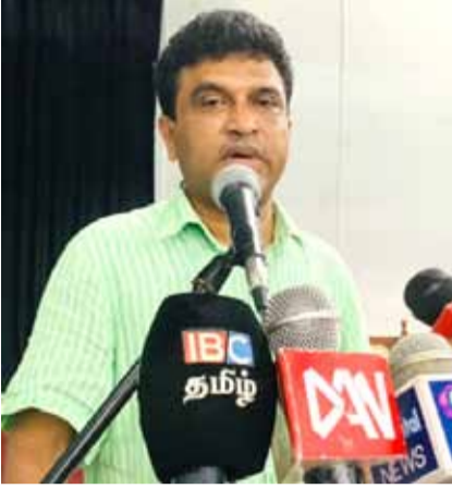
(19) மாலை இடம்பெற்றபோது அந்நிகழ்வில் பிரதம அதிதியாக கலந்துகொண்டு உரையாற்றும் போதே அவர் மேற்கண்டவாறு தெரிவித்தார்.