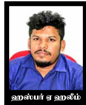
ஹஸ்பர் ஏ ஹஸீம்

ருந்த நிலையில் 13,387,951 (83.72) வீதமான வாக்களிப்பு இடம் பெற்றுள்ளது. தேர்தல் வன்முறைகளை கண்காணிப்பதற்கான நிலையத்தின் (CMEV) தேர்தல் அவதானிப்பு அறிக்கையின் படி திருகோணமலை மாவட்டத்தில் தேர்தலுக்கு முன்னர் ஆறு சம்பவங்கள் பதிவாகியுள்ளது. தாக்குதல் சம்பவம் 01, அரசு வாகனங்கள் முறைகேடாக பாவித்தமை 03, தீக்கிரையாக்கல் 01, அரசு அதிகாரியின் பகிரங்க அரசியல் ஈடுபாடு 01 என வன்முறைகள் பதிவாகியுள்ளது மேலும் சிறிய சம்பவங்களாக சட்ட முரணான பிரச்சாரம் 01, சட்ட முரணான கவரொட்டிகள் பதாகைகள் 03, தேர்தல் குற்றங்கள் 05 என ஒன்பது சம்பவங்கள் இணங்காணப்பட்டன. குறிப்பாக வன்முறை சம்பவங்களாக தாக்குதல், இலஞ்சம், சட்ட முரணான பிரச்சாரம், முரணான கவரொட்டிகள்,