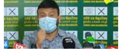
நாட்டு மக்களைப் பட்டினியில் வாடவைத்த அரசு என இந்த அரசு வரலாற்றில் இடம்பிடிக்கும்” - என்றார்.

முறை வாழ்த்துக்கூட கூற முடியாத நிலைமை ஏற்படும். ஏனெனில், பாரிய உணவுத் தட்டுப்பாடு ஏற்படும் அபாயம் உள்ளது. வறுமை நிலையும் உருவாகும். பட்டினியால் வாட வேண்டிய நிலை ஏற்படும்.