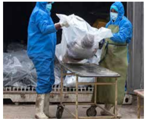
கொழும்பு, டி.செ. 21

கொரோனா தொற்று காரணமாக நேற்று முன்தினம் மட்டும் நாடு முழுவதும் 19 பேர் உயிரிழந்தனர் என்று சுகாதார சேவைகள் பணிப்பாளர் நேற்று தெரிவித்தார்.