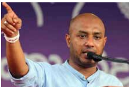
குறிப்பிட்டுள்ளார். அவர் மேலும் தெரிவிக்கையில், “அசெளகரியத்துக்கு முகங்கொடுத்துள்ள விவசாயிகளின் நன்மை