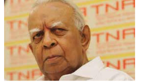
மதிப்பளிப்பதாக இருந்ததென்றே கருத முடியும்.

அத்துடன், நல்லூர் ஆலய ஆசாரத்துக்கு மதிப்பளிக்கும் வகையில் சீன அதிகாரிகள் தமது மேலங்கிகளையும் கழற்றியிருந்தனர். இவ்வாறு சீனத் தூதரும் அவரின் அதிகாரிகளும் நல்லூரில் சுவாமி தரிசனம் செய்தமை யாழ்ப்பாணத் தமிழரின் கலாசாரத்துக்கு