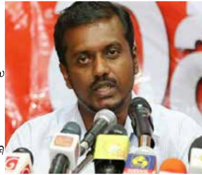
வைரஸ் பரவுவதைத் தடுக்கலாம். 2ஆவது அலையைக்கூட தவறான அரசியல் தீர்மானத்தால்தான் ஏற்பட்டது. இன்று பி.சி.ஆர். பரிசோதனை உரிய வகையில் மேற்கொள்ளப்படுவதில்லை. உண்மையான தரவுகளும் வெளிப்படுத்தப்படுவதில்லை. எவ்வித திட்டமிடல்களும் இன்றி, போலியான தகவல்களை மையப்படுத்தியே தற்போது நடவடிக்கைகள் இடம் பெறுகின்றன” - என்றார். (இ)

கட்டுப்படுத்துவது? இது சுகாதார அமைச்சுக்கு விளங்காதது ஏன்? இலங்கையில் விமான நிலையம் அச்சுறுத்தலாக மாறியுள்ளது. நைஜீரியாவுக்குச் சென்று வந்த நிலையில் ஒமிக்ரோன் தொற்றிய தனியார் பல்கலைக் கழக பேராசிரியர் ஒரு தடுப்பூசி கூட பெறவில்லை. அவ்வாறு பெறாதவர் எப்படி வெளிநாடு சென்றிருக்க முடியும்? சுகாதார வழிகாட்டல்கள் பின்பற்றப்படுவதில்லை. வெளிநாட்டில் இருந்து வரும் சுற்றுலாப் பயணிகள், அரசியல் பலம்மிக்க சுற்றுலா ஏஜன்சுகளால், தமக்குத் தேவையான ஹெட்டல்களுக்கு அழைத்துச் செல்லப்படுகின்றது. இது தொடர்பில் சுகாதாரப் பரிசோதகர்களுக்கு அறிவிக்கப்படுவதில்லை. எமது நாடு ஒரு தீவு. இங்கு