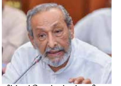
தீர்த்துக்கொள்ளத் தற்காலிக உடன்படிக்கைகளை மேற்கொள்ள வேண்டும். எமது அரசு சர்வதேச நாணய நிதியத்தை நாடும் தீர்மானத்தை எடுத்தால் அரசில் இருக்கமாட்டேன்” - என்றார். (இ)

கொழும்பு, டி.செ. 21 “இலங்கை அரசு, சர்வதேச நாணய நிதியத்தை நாடும் பட்சத்தில் மறுநொடியே அரசிலிருந்து உடனே வெளியேறுவேன். சர்வதேச நாணய நிதியத்திடம் கடன் பெறுவதென்பது ஏழு பரம்பரைகளுக்குப் பாதகமாகவே அமையும்.” - இவ்வாறு ஜனநாயக இடதுசாரி முன்னணியின் தலைவரும் அமைச்சருமான