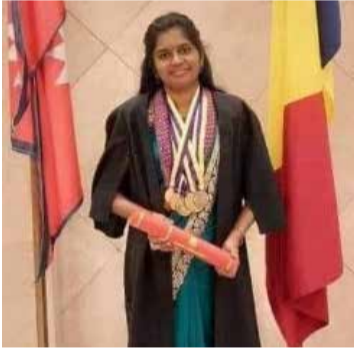
தமிழ் மாணவி சாதனை

ஒதுக்கப்படும் நிதியை படிப்படியாக குறைத்தல், ரூபாயின் பெறுமதியைச் சுதந்திரமாகத் தீர்மானிக்க விடுதல் எனப் பல நிபந்தனைகள் உள்ளன. இவற்றை ஏற்றால் அவை நாட்டுக்கு பாதக விளைவுகளையே தரும். அப்படியானால் மாற்றுவழி என்னவென்று சிலர் கேட்கலாம், எமது நட்பு நாடுகளுடன் டொலர் பிரச்சனையை