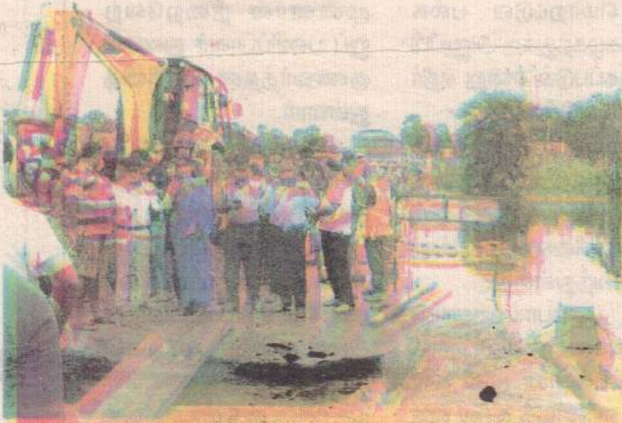
இரவாக மேற்கொண்டும் வேகமான நிரோட்டி போதும் 75 வீதமான மக்கள் இடம்பெயர்ந்துள்ளனர். பிரதான வீதியில் அமைக்க கோள் விடுத்தனர். அத்துடன் கடும் மழை மற்றும் கல்வெட்டு

மன்னார், டிசெ.2 தலைமன்னார் ஏ-14 பிரதான வீதியில் அமைக்கப்பட்டிருந்த கல்வெட்டு உடைந்தமையால் போக்குவரத்துத் தடைபட்டுள்ளது. இதனையடுத்து வீதி அபிவிருத்தி அதிகாரசபை தற்காலிகமாக போக்குவரத்தைச் சீர் செய்வதற்கு நடவடிக்கை எடுத்துள்ளது. பேசாலை கிராமத்தில் கட்டுமையான மழையிலும், இளைஞர்கள் வாய்க்கால் களை வெட்டி நீரைக் கடலுக்குள் வெளியேற்றுவதற்கான முயற்சியில் இரவு