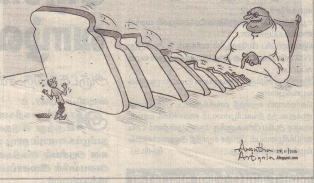
Anantha 29/11/2021 Artignia.blogspot.com

இலங்கையில் இரசாயன உரத்தை இறக்குமதி செய்வதற்கு அரசு தடைசெய்தபோது, டொலர் பற்றாக்குறையாலேயே இந்தத் தடை என்று - எதிர்க்கட்சி குற்றஞ்சாட்டியது. ஆனால், அரசோ மக்களின் நலனைக் கருத்திற்கொண்டுதான் இந்தத் தடையென்றும் இயற்கையான உரத்தைப் பயன்படுத்துவதை ஊக்குவிக்கும் வகையில் தான் அரசு செயற்படுகின்றது என்றும் - சப்பைக் கட்டு கட்டியது. கேள்வி என்னவென்றால், மியான்மரில் இருந்து இறக்குமதி செய்யப்படும் அரிசி எந்த உரத்தில் உற்பத்தி செய்யப்பட்டது? அது இயற்கை உரத்தில் உற்பத்தி செய்யப்பட்டது என்பதற்கு என்ன உத்தரவாதம்? ஒருவேளை மியான்மர் அரிசி இரசாயன உரத்தைப் பயன்படுத்தி விளைவிக்கப்பட்ட நெல்லில் இருந்தே பெறப்பட்டது என்றால், தலையைச் சுற்றி மூக்கைத் தொடாமல் இலங்கை விவசாயிகளுக்கே இரசாயன உரத்தைப் பெற்றுக்கொடுத்து இங்கேயே நெல்லில் தன்னிறைவு காணலாமே! 'மாதனமுத்த' மரபில் வந்த குடும்பம் ஆட்சி செய்தால் இப்படித்தான் முடிவுகளை எடுத்து, தாமும் குழம்பி, மக்களையும் குழப்பி, நாட்டையும் குழப்புவார்கள்.