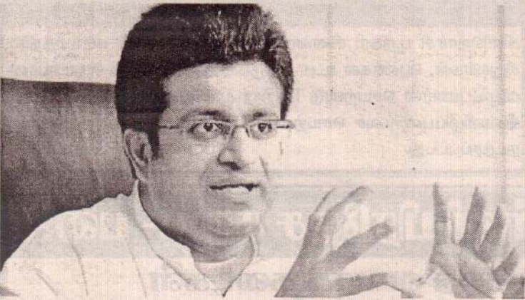
(கொழும்பு) கச்சா எண்ணெயை இறக்குமதி செய்வதற்கு தொடர்ந்து நடவடிக்கை எடுக்கப்படும் என