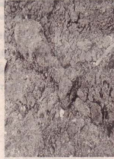
(யாழ்ப்பாணம்) யாழ்ப்பாணம் பொலிஸ் பிரிவுக்குட்பட்ட அரியாலை -

புங்கன்குளம் பகுதியில் உள்ள வீடொன்றில் இருந்து சிறியரக மோட்டார் குண்டு மீட்கப்பட்டுள்ளது.