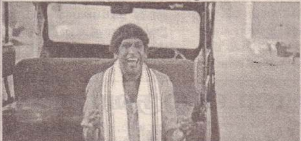
ஓஹ் புரிஞ்சு போச்சுடா ஏற்கனவே நிறைய பிரச்சனை இருக்கிற நமக்கு புதுசா ஒரு பிரச்சினைய குடுக்க வேண்டாம்னு கடவுள் நினைக்கிறார் போல

என்ன எல்லாருக்கும் கல்யாணமாகுது நமக்கு மட்டும் ஆக மாட்டோங்குது