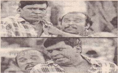
இருடா எனக்கும் ஒரு மாறி பதட்டமாக தான் இருக்கு. வரட்டும் பார்ப்போம்...

அங்க பாருங்க 2022 வேகமா வந்திட்டு இருக்கு