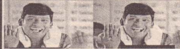
5 வது ஆளு