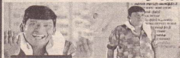
3 வது ஆளு