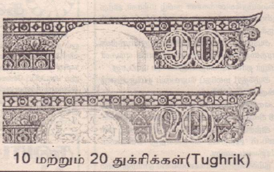
10 மற்றும் 20 துகரீக்கள்(Tughrig)

உஸ்பெக் போன்றவை) மற்றும் ரஷ்ய மொழி ஆகியவை பொதுவான பயன்பாட்டில் உள்ளன. மாங்கோலியன் எண்கள் திபெத்திய எண்களிலிருந்து உருவாக்கப்பட்ட எண்கள் மற்றும் மாங்கோலியன் மற்றும் தெளிவான எழுத்துக்களுடன் இணைந்து பயன்படுத்தப்படுகின்றன. மாங்கோலியன் எண்கள் உரு 32 இல் காட்டப்பட்டுள்ளது. இது இந்து-அரபு எண் முறையைப் போன்றது.