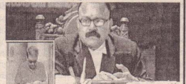
ஒன்னுக்கு ரெண்டு வாட்டி யோசிச்சிக்கோ. இதுமாதிரி பொண்டாட்டி கிடைக்கிறது அபூர்வம்

ஐயா குணு மாசமா என பொண்டாட்டி என்கூட பேசுறது இல்லை சிதனால் எனக்கு டைவர்கள் குடுங்க