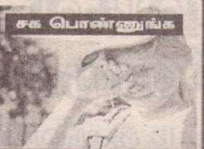
சக பொண்ணுங்க சக நண்பர்கள்

நங்கள் பார்த்த பேஸ்புக்கில் உங்களுக்குப் பிடித்தவைகளை www.facebook.com/valampurii எனும் தளத்தில் பதிவு செய்யுங்கள். அவை உங்கள் பெயர்களுடன் facebook பார்த்ததில் பிடித்தவை பகுதியில் பிரசுரமாகும்.