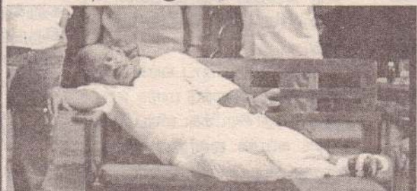
கணவன் : கல்யாணம் ஆன நான்ல இருந்து என்னைய அப்படி தானடி வச்சிருக்க

மனைவி : வடகொரியாவில் 10 நாட்களுக்கு சிரிக்க தடை செஞ்சி இருக்காங்களாம்