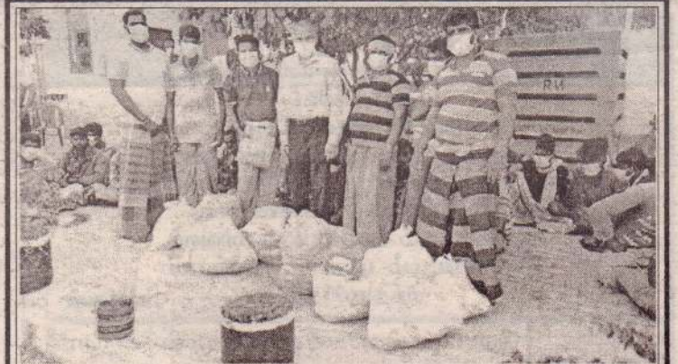
யாழ். இந்திய துணை தூதரகத்தினால் மயிலிட்டியில் தடுத்து வைக்கப்பட்டுள்ள 43 இந்திய மீனவர்கள் மற்றும் மன்னாரில் தடுத்து வைக்கப்பட்டுள்ள 12 இந்திய மீனவர்களுக்கு தேவையான உடைகள் உட்பட அத்தியாவசியப் பொருட்கள் மற்றும் முக்கவசங்கள் என்பன நேற்று முன்தினம் வழங்கப்பட்டன. இந்தியாவில் உள்ள அவர்களது குடும்ப உறுப்பினர்களுடன் தொலைபேசி வாயிலாக உரையாடுவதற்கான ஏற்பாடுகளும் ஒழுங்கு செய்து கொடுக்கப்பட்டுள்ளன.

எல்லைப்படுத்தல் குழு அங்கீகாரம் வழங்கும் போது 2023 அல்லது 2024 ஆம் ஆண்டில் தென்மராட்சியில் இரண்டு பிரதேச செயலகங்கள் அமையப்பெறும் என தெரிவித்தார். (4-5-30)