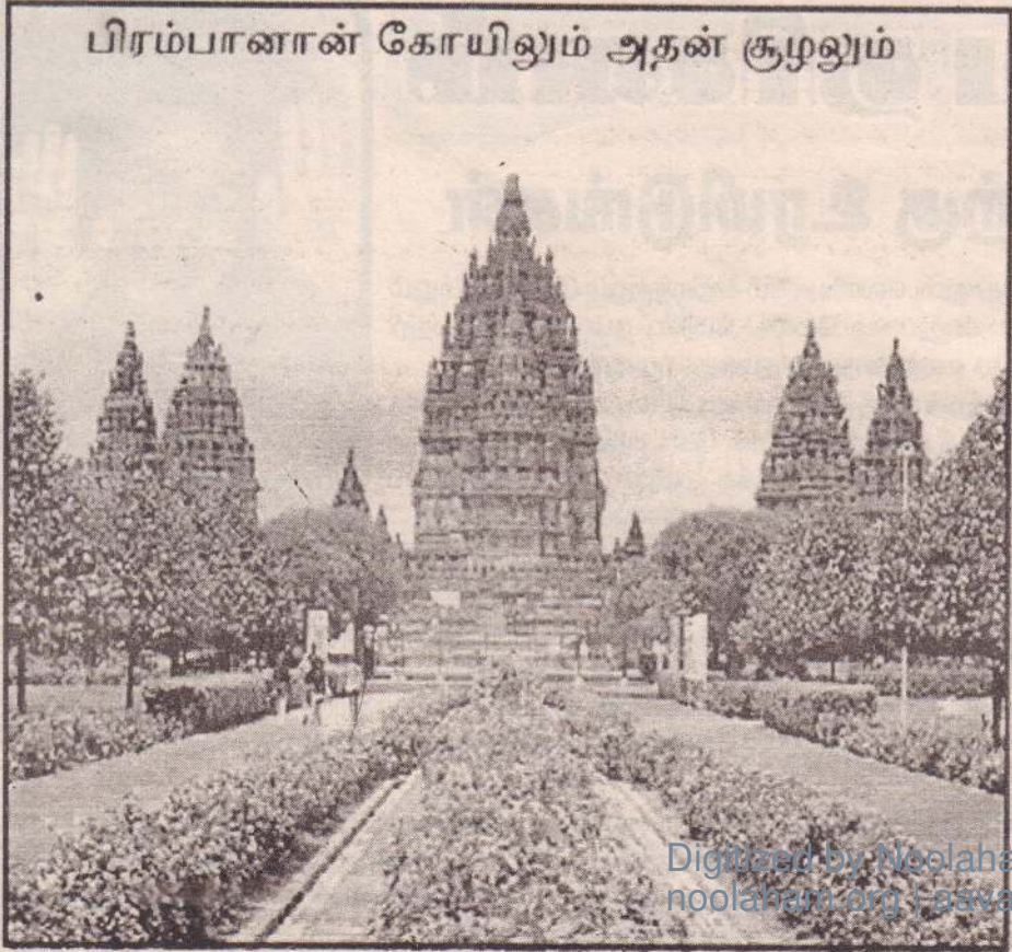
பிரம்பானான் கோயிலும் அதன் குழலும்

ஒடியா (ஒடிசா) எண்கள் பயன்படுத்தும் மொழி ஒடியா மொழி ஆகும். அதாவது எண்கள் தத்தமது மொழிகளை மருவியே உருவாக்கப்பட்டுள்ளன. சில திராவிட மொழிகளில் எண்களின் உச்சரிப்பை உரு 35 A இல் காட்டப்பட்டுள்ளது.