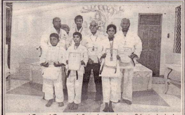
கராத்தே சம்மேளனத்தினால் அண்மையில் நடத்தப்பட்ட இணையவழி கராத்தே போட்டியில் பருத்தித்துறை தற்காப்புக்கலையக மாணவர்கள் 3 தங்கம், 3 வெள்ளி, ஒரு வெண்கலப் பதக்கங்களை சுவீகரித்தனர்.

இரு அணிகளுக்கிடையிலான நான்காவது டெஸ்ட் போட்டி, எதிர்வரும் ஜனவரி 4 ஆம் திகதி சிட்னி மைதானத்தில் நடைபெறவுள்ளது. (4)