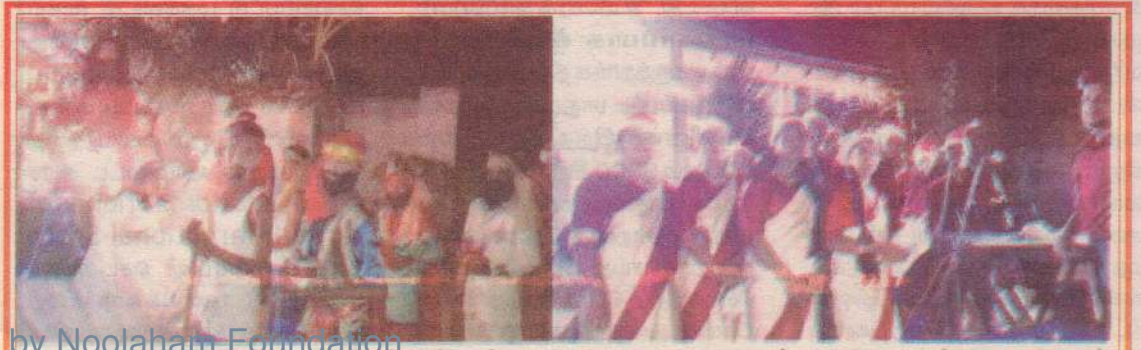
நகத்தார் தினத்தை சிறப்பிக்கும் முகமாக பாஷையூர் புனித அந்தோனியார் ஆலயத்தினரால் கிறிஸ்து பிறப்பு காட்சிப்படுத்தல்களுடனான கரோல் நிகழ்வு இரு நாட்கள் நடைபெற்றன.

யைச் சேர்ந்த இரண்டு பேரை கைது செய்தனர். கைதான இருவரையும் நேற்று செவ்வாய்க்கிழமை சாவகச்சேரி நீதிமன்றத்தில் முற்படுத்தியபோது இருவருக்கும் தலா 15,000 ரூபாய் விகிதம் அபராதம் விதிக்கப்பட்டது. (5-4-30)