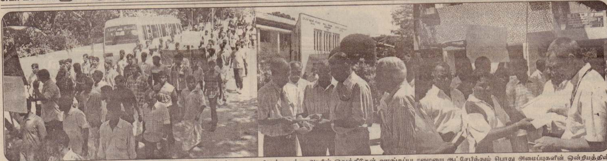
கழகக் படுகொலைகளைக் கண்டிக்கும் சனாமியால் பாதிக்கப்பட்ட வடபகுதி மக்களுக்கு அரசின் ஒதுக்கீடுகள் வழங்கப்படாமையை ஆட்சேபிக்கும் பொது அமைப்புகளின் ஒன்றியத்தின் ஏற்பாட்டில் நேற்றுக் கண்டனப் பேரணி நடத்தப்பட்டது. பதாகைகளைத் தாங்கியவாறு பேரணியில் கலந்துகொண்டோர் ஊர்வலமாகச் செல்வதையும் யாழ். அரசு அதிபர் கே.கணேஷ், கண்காணிப்புக் குழுவின் யாழ். அலுவலகப் பிரதிநிதி ஆகியோரிடம் மகஜர்கள் கையளிக்கப்படுவதையும் படங்களில் காணலாம். (படங்கள்: பிரபா, கவிதரன்).

சுடர் 20 வள்ளுவர் ஆண்டு 2036 மாசி 06 வெள்ளிக்கிழமை [18.02.2005] UTHAYAN-A Lively National Tamil Daily கதிர் : 84