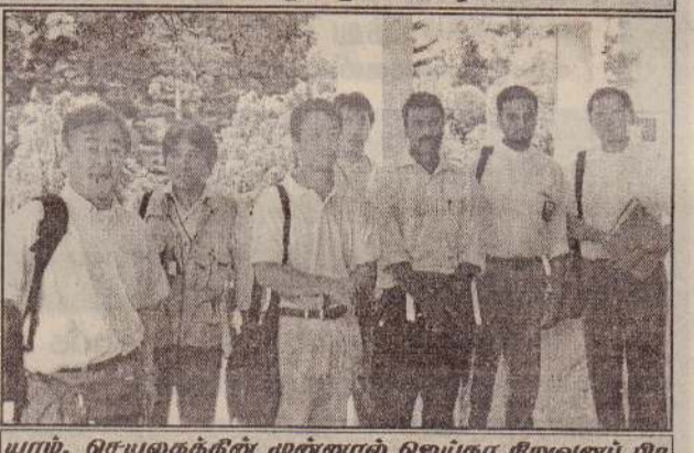
யாழ்ப்பாணம், பெப். 18. செயலகத்தில் முன்னால் ஜெய்கா நிறுவனப் பிரதிநிதிகள் நிற்பதைப் பட்டத்தில் காணலாம்.

அடுத்தமாக இறுதிப் பகுதியில் கட்டவேண்டிய ஆரம்பமாகுமென்றும் 'ஜெய்கா' நிறுவனத்தின் வடக்கு - கிழக்கு மாகாண