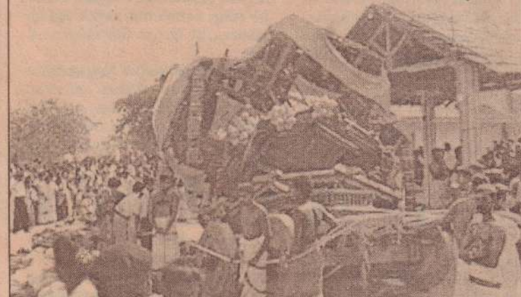
குடைசாய்ந்த ரதத்தின் ஒரு தோற்றம்...