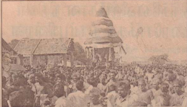
செல்வச்சந்நிதி ஆலயத்தின் ரதம் இருப்பிடத்திலிருந்து புறப்பட்ட போது...

கிளிநொச்சி, செப்.10 மட்டக்களப்பு சத்துருக்கொண்டானில் 184 அப்பாவிப் பொதுமக்கள் படுகொலைசெய்யப்பட்டதன் 13ஆம் ஆண்டு நினைவுதினம் நேற்று உணர்வுபூர்வமாக அனுஷ்டிக்கப்பட்டது. 1990ஆம் ஆண்டு செப்ரெம்பர் மாதம் 9ஆம் திகதி மட்டக்களப்பு சத்துருக்கொண்டான் பகுதியில் பண்டியனராலும், ஊர்காவற்படையினராலும் 184 அப்பாவிப்பொதுமக்கள் படுகொலை செய்யப்பட்டனர். இந்த துயரச் சம்பவத்தின் 13ஆவது நினைவுதினம் மட்டக்களப்பின் பல பகுதிகளிலும் நேற்று உணர்வுபூர்வமாக அனுஷ்டிக்கப்பட்டது. சத்துருக்கொண்டானில் நேற்றுப் (12ஆம் பக்கம் பார்க்க)