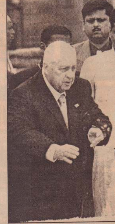
இஸ்ரேலியப் பிரதமர் எரியல் ஷெலோன் இந்தியாவுக்கு உத்தியோகபூர்வ விஜயம் மேற்கொண்டு வருகிறார். அவர் நேற்று மகாத்மா காந்தியின் நினைவிடத்துக்குச் சென்று மலர்கூர்வார் அஞ்சலி செலுத்தினார். அவரது இந்திய விஜயத்துக்கு கி.பி.சாரீக் கட்சிகள் கருத்து தெரிவித்துள்ளன. அவை நடந்தன. ஷெலோன் இந்த விஜயத்தின் மூலம் இரு நாடுகளுக்கும் கிடையான பாதுகாப்பு உறவுகள் மேம்படும் எனத் தொழிலாளர்களுக்கு

லண்டன், செப். 10 ஈராக் நிலைமை கட்டுமீறிய போவதால் மேலதிகமாக 1,200 துருப்பினரை அங்கு அனுப்ப பிரிட்டிஷ் முடிவு செய்திருக்கின்றது. இதனை பிரிட்டிஷ் பாதுகாப்பு அமைச்சர் ஜியோவ் ஹீன் நேற்று முன்தினம் தெரிவித்தார். ஈராக்கின் தென்புல நகரான பஸ்ரா வில் ஏற்கனவே 11,000 பிரிட்டிஷ் துருப்பினர் நிலைகொண்டுள்ளனர். ஆனால், அங்கு பாதுகாப்பை உறுதிப்படுத்த அவர்களால் முடியவில்லை. இதனால், மேலதிக துருப்பினரை அனுப்ப முடிவு செய்யப்பட்டுள்ளது. இதற்கிடையே, சதாமின் சொந்த ஊரான திக்ரீத்தை நேற்றுமுன்தினம் அதிகாலை திடீரென முற்றுகையிட்ட அமெரிக்கப் படையினர், அங்குள்ள அனைத்து வீடுகளையும் சல்லடைபட்டுத் தேடுதல் நடத்தியிருக்கின்றனர். இந்தத் தேடுதலின்போது சதாமின் ஆதரவாளர்களுக்கு நிதியுதவி அளிப்பவர்கள் எனக்கூறி நான்கு பேரை அவர்கள் கைதுசெய்தனர். திக்ரீத்தை முற்றுகையிட்டுள்ள அமெரிக்க படையினர் அங்கிருந்து இன்னமும் வெளியேறவில்லை.