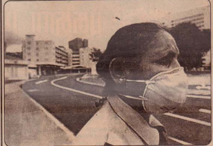
சிங்கப்பூர், செப். 10

பெளச்சி உண்மை என்னவாக இருந்திருக்கும் என்பதை உணர்ச்சியுடன் என்று தெரிவித்துள்ளார். கடந்த எட்டு நாட்களுக்கு முன் வெள்ளை மாளிகை வெளியிட்ட தகவலின்படி சூகி உண்ணாவிரதம் இருக்கிறார் என்று முதலில் கூறியது இவர்தான். இவரின் இந்தக் கூற்று காரணமாகவே - உண்மையை வெளியிடுத் தவே - சூகியை சந்திக்க செஞ்சிலுவைச் சங்கத்திற்கான சர்வதேச குழுவை அனுமதித்தோம் என்று மியான் மரின் புதிய பிரதமர் கூறியுள்ளார். சர்வதேசத்தின் அழுத்தத்தை மியான்மார் இராணுவ ஆட்சியாளர் மீது ஏற்படுத்தும் நோக்கத்திலேயே வெள்ளை மாளிகை, சூகி உண்ணாவிரதம் இருக்கிறார் என்று திரித்துக் கூறியதாக, பெயர் குறிப்பிட விரும்பாத அதிகாரிகள் சிலர் தெரிவித்துள்ளனர்.