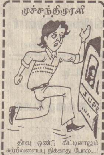
தீர்வு ஒண்டு கிட்டினாலும் சுற்றிவளைப்பு நிக்காது போல...!

கொழும்பு ஆங்கில வார இதழுக்கு அளித்த பேட்டி ஒன்றிலேயே அவர் இதனைத் தெரிவித்துள்ளார். தீர்வுத்திட்டத்தை மூன்று மாத காலத்துக்குள் நாடாளுமன்றத்தில் சமர்ப்பிப்பது என்றும் - அதற்கு முன்னர் பொதுமக்கள் ஐக்கிய முன்னணியில் அங்கம் வகிக்கும் கட்சிகளுடனும் ஐ.தே.க.வுடனும் பேச்சு நடத்தி அவைகளின் ஒப்புதலை இதற்குப் பெறுவது என்றும் ஜனாதிபதி தலைமையில் கடந்த விழாக்கிழமை நடைபெற்ற கூட்டத்தில் முடிவு செய்யப்பட்டது தெரிந்ததே. இது தொடர்பாகக் கருத்துத் தெரிவிக்கையிலேயே அமைச்சர்