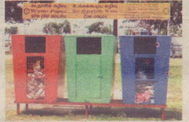
யாழ். மாநகர சபையால் நகரப் பகுதிகளில் கழிவுப் பொருள்களைச் சேகரிப்பதற்கான தொடக்கம் வைக்கப்பட்டுள்ளன. மக்கள் கூடுதலாக நடைபயிற்சி பகுதிகளில் அவை வைக்கப்பட்டுள்ளன. கடத்தாசிக் கழிவுகள் மற்றும் உக்கும், உக்காது கழிவுகள் என வேறாகக் மக்கள் இந்தக் கழிவு சேகரிக்கும் தொடக்கத்தில் போட வேண்டும் எனவும் அதில் அறிவுறுத்தப்பட்டுள்ளது. (17-2-16)

ஆம் திகதிக்கு முன்னர் தங்கள் பிரதேசத்தில் பாதீனியம் ஒழிக்கப்பட்டுள்ளது என்று உறுதிப்படுத்தப்பட வேண்டும் என்று பணிப்புரை விடுக்கப்பட்டது. அந்த விடயத்தில் நல்லூர் பிரதேச சபை இந்தக் கடிதத்துக்கு ஒத்துழைப்பு நல்கி தங்களுக்கு இந்தக் காலம் போதாமல் உள்ளது என்றும் கால அவகாசம் கோரி மீள் கடிதம் அனுப்பி வைத்தனர். அதன் பிரகாரம் அவர்களுக்கு கால அவகாசம் வழங்கப்பட்டது. அதன் பின்பு நல்லூர் பிரதேச சபை தனது முழுமையான அறிக்கையை வழங்கியுள்ளது. அவர்கள் முன்மாதிரியாகச் செயற்படுகின்றனர். ஏனைய பிரதேச சபைகளும் இதே போன்று செயற்பட வேண்டும் - என்றார். அதேவேளை, கடந்த ஞாயிற்றுக்கிழமை நல்லூர் பிரதேச சபையில், சபையின் செயலாளர் தலைமையில் பொதுமக்களுக்கு விழிப்புணர்வு ஏற்படுத்தும் வகையில் தங்களது பிரதேசத்துக்குட்பட்ட சனசமூகநிலையங்களுக்கு அழைப்பு விடுத்து பாதீனிய அழிப்புத் திட்டமிடல் தொடர்பாக கலந்துரையாடல் ஒன்றும் நடத்தப்பட்டது. (17-2-16)