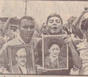
மன்னரின் மறைவுத் துயரால் கண்ணீர் சீங்கும் காத்மண்டூ நகரவாசிகள் மன்னரதும் மகாராணியினதும் படங்களைத் தாங்கியவாறு காணப்படுகின்றனர்.

முன்னதாக இராணுவ மருத்துவமனையில் இருந்து நேபாள அரச குடும்பத்தவரின் குலதெய்வக் கோயிலான பகபதிநாத் ஆலயத்தின் அருகே பாஸ்மதி நதிகரை வரை சடலங்கள் சுமார் 8 கிலோ மீற்றர் தூரத்துக்கு ஊர்வலமாக எடுத்துச்செல்லப்பட்டன. அப்போது வீதிகளின் இரு புறங்களிலும் திரண்டிருந்த சுமார் 10 லட்சம் நேபாளியர்கள், அரச குடும்பத்தவரின் உடல்களைப் பார்த்து கண்ணீர் விட்டுக் கதறியழுதனர்.