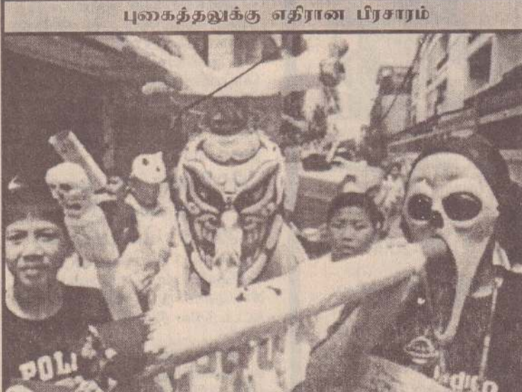
கடந்த வியாழக்கிழமை சர்வதேச புகைத்தல் எதிர்ப்புத் தினம் உலகெங்கும் கடைப்பிடிக்கப்பட்டது. அதனையொட்டி பாங்கொடுவில் புகைத்தலின் கெடுதலைய வளக்கும் வகையில் பாக்கி மாணவர்கள் நகர வீதியில் பிரசாரத்தில் ஈடுபட்டிருப்பதைப் படத்தில் காணலாம்.

வாஷிங்டன், ஜூன் 4 அமெரிக்காவில் ஓரினச் சேர்க்கையில் ஈடுபடும் கறுப்பின வாலிபர்களிடையே எம்ட்ஸ் நோய் பரவுவது அதிகரித்துள்ளது. நோய்த் தடுப்புக்கான மத்திய நிலையம் இதனை அறிவித்துள்ளது. வருடாந்தம் இவர்களிடையே 37 சதவீத அதிகரிப்பு காணப்படுவதாகவும் அது தெரிவித்துள்ளது. (ஐ-7)