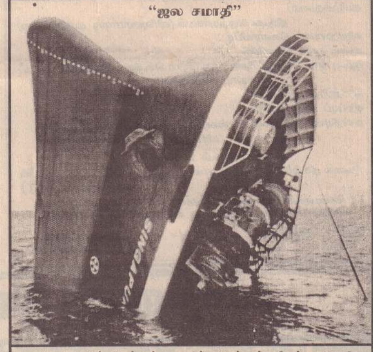
மலேசியாவின் மேற்குக் கடலில் அண்டன் தீவுக்கு அருகே, கடந்த திங்கட்கிழமை, பனாமா கப்பலான 'சிங்கப்பூர்டைம்' விபத்துக்குள்ளாகி, நீர்ல் முழக்கக் கொண்டிருந்த சமயம் எடுத்த படம். மற்றொரு கப்பலுடன் மோதி விபத்துக்குள்ளான கிந்தக் கப்பலின் பணியாளர்கள் அனைவரும் பத்திரமாக மீட்கப்பட்டனர்.

அதனால், நேபாளத்தின் நிலை குறித்து இந்தியா கூடுதல் கவனத்துடன் ஆராய்ந்ததாகக் கூறப்படுகிறது. (ஏ-6-9)