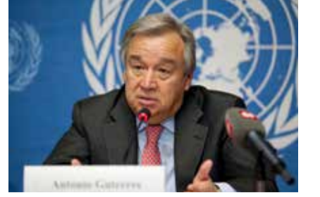
கட்டுப்படுத்தும் முயற்சிக்கு உலக நாடுகள் அதிக நிதியை ஒதுக்க வேண்டும் எனவும் ஐ.நா. பொதுச் செயலாளர் அன்ரனியோ குட்டரோஸ் கோரிக்கை விடுத்தார்.

உலக பெருந்தொற்று தயாராதல் தினத்தில் பெருந்தொற்றுக்கள் குறித்து உரிய கவனம் செலுத்த வேண்டும். அத்துடன், இவற்றைக்