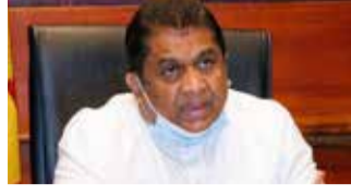
வாயு சிலிண்டர்களின் தட்டுப்பாட்டுக்கு நுகர்வோரின் பாதுகாப்பும் ஒரு காரணம்.

அழகியவண்ண தெரிவித்தார். இது தொடர்பில் ஊடகங்களிடம் அவர் மேலும் தெரிவித்ததாவது: - “சமையல் எரிவாயுக்களின் தரம் தொடர்பில் பரிசோதிக்கும் அதிகாரம் இலங்கை கட்டளைகள் நிறுவனத்துக்கு வழங்கப்பட்டுள்ளது. சமையல் எரி