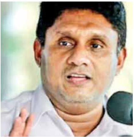
அடுத்து நாடளாவிய ரீதியில் உள்ள 34 வைத்திய சாலைகளுக்கு 101 மில்லியன் மதிப்புள்ள மருத்துவ உபகரணங்களை நன்கொடையாக வழங்கியுள்ளதாகவும் சஜித் பிரேமதாஸ் கூறினார்.

ஐக்கிய மக்கள் சக்தியின் மருத்துவ உப கரண நன்கொடை திட்டமான 'ஹஸ்மாக்'க்கு சீன அரசாங்கம் 19.6 மில்லியன் ரூபாவை நன்கொடையாக வழங்கியது. சீனத் தூதுவர் குய் ஜென்ஹாங்கிடமிருந்து நன்கொடையை எதிர்க்கட்சித் தலைவர் சஜித் பிரேமதாஸ் ஏற்றுக் கொண்டார். சிறு நீரக நோயாளர்களுக்கான டயாலிசிஸ் இயந்திரங்களைக் கொள்வனவு செய்வதற்கு இந்த நிதி பயன்படுத்தப்படும் எனத் தெரிவித்தார். ஒரு வெளிநாட்டுத் தூதரகம் எதிர்க்கட்சிக்கு நிதி வழங்குவது இதுவே முதல் முறை எனக் குறிப்பிட்ட சஜித் பிரேமதாஸ், சீனாவின் நம்பிக்கையை தம்மால் வெல்ல முடிந்துள்ளது என்றும் பெருமிதம் வெளியிட்டார். கொரோனா தொற்று பரவலை