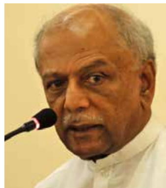
எப்படி வேண்டும் - என்றார்.

ஏனைய மக்கள் முகம் கொடுக்கும் பிரச்சினைகளுக்குத் தீர்வு காண்பதற்காக சிறந்த முகாமைத்துவத்துடனான முன்னெடுப்புகள் மேற்கொள்