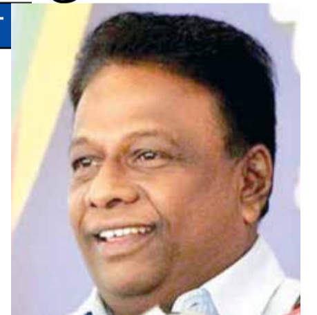
மாற்றம் பற்றி எமக்கு உறுதியாக கூற முடியாது.

அவர் மேலும் தெரிவித்ததாவது: - அமைச்சரவை மாற்றம் குறித்து சமூக ஊடகங்களில் தகவல்கள் பரவி வருகின்றன.