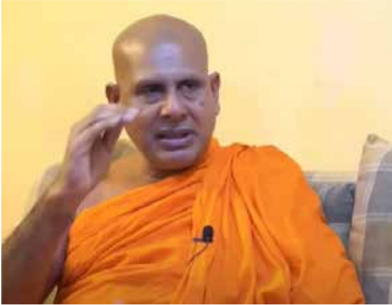
அமைச்சர் ஜோன்ஸ்டன் பெர்னாண்டோ கூறுகின்றமை போல் சீனாவின் கழிவுக் கப்பலுக்கு செலுத்திய 67 லட்சம் டொலர் பணம் சிறிய தொகையாக என கேட