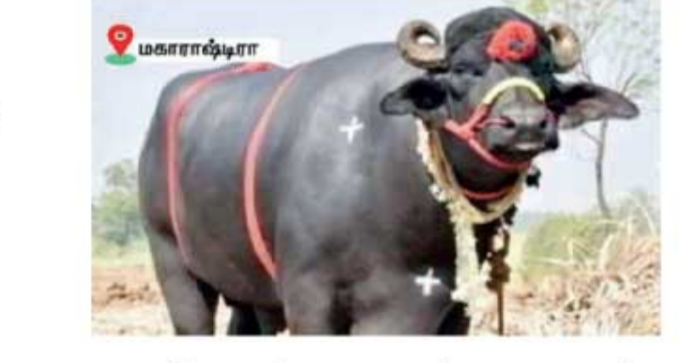
உட்கொள்வதாகவும் மாட்டின் உரிமையாளர் கூறியுள்ளார். இனப்பெருக்கத்துக்கு இந்த வகை மாடுகள் பெரிதும் உதவும் என்பதால் பல இலட்சம் கொடுத்து வாங்க விவசாயிகள் போட்டி போட்டுள்ளனர்.

ம ராட்டிய மாநிலம் ஷாங்கிலி மாவட்டத்தில் எருமை மாடொன்று ஒன்று ரூ. 80 இலட்சத்துக்கு ஏலத்தில் விற்பனையாகியுள்ளது. சுகஜெந்திரா என்ற அந்த எருமை சுமார் ஒன்றரை டன் எடையுள்ளது. அந்த எருமையிடம் செல்பி எடுக்க மக்கள் அதிக ஆர்வம் காட்டி வருகின்றனர். எடையை பராமரிக்க இந்த மாடு ஒரு நாளுக்கு 15 லீற்றர் பால் குடிப்பதாகவும், நான்ற வேலையும் சுரும்பு, புற்கள்