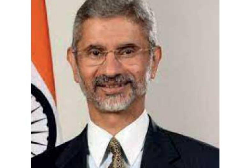
இந்திய வெளியுறவுத்துறை அமைச்சர் ஜெய்சங்கர், "ஆப்கானிஸ்தானில் ஒருங்கிணைந்த கூட்டாட்சி மலரவும், ஆப்கான் மக்களின் வாழ்வாதாரத்தை மேம்படுத்தவும் பொருளாதார ரீதியாக இந்தியா உதவும்" என்று உறுதியளித்தார்.

ஆ ப்கானிஸ்தான் வளர்ச்சிக்கு இந்தியா உதவுமென இந்திய வெளியுறவுத்துறை அமைச்சர் ஜெய்சங்கர் உறுதி அளித்துள்ளார். புதுடெல்லியில் நேற்று முன்தினம் (19) நடைபெற்ற வெளியுறவுத்துறை அமைச்சர்கள் கூட்டத்தில் இந்திய வெளியுறவுத்துறை அமைச்சர் ஜெய்சங்கர் கலந்து கொண்டார். கஜகஸ்தான், தஜிகிஸ்தான், டர்சுமெனிஸ்டன், உஸ்பெகிஸ்தான், கியார்கஸ் குடியரசு உள்ளிட்ட பல நாடுகளின் வெளியுறவுத்துறை அமைச்சர்கள் கலந்து கொண்ட இந்த கூட்டத்தில் பேசிய