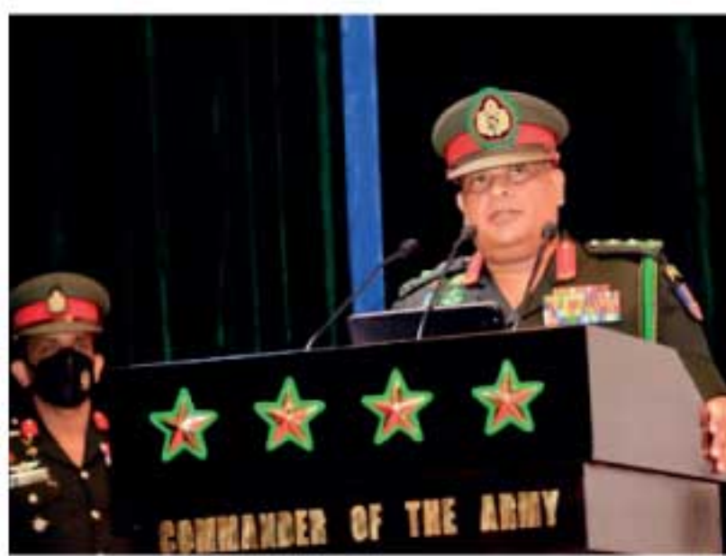
அதிகாரியாக மாற்றப்படுவதன் முக்கியத்துவம் தொடர்பிலும் எடுத்துரைத்தார்.

இராணுவத்தினர் தொழில்முறை வளர்ச்சிப் பாதையில் முன்னேற்றம் காணும்போது எந்த அழுத்தங்களையும் உள்வாங்கும் திறன் கொண்டவராக தன்னம்பிக்கையுடன் தனித்து நிற்க வேண்டுமென இராணுவத் தளபதி ஜெனரல் ஷவேந்திர சில்வா, இராணுவத்தினருக்கு ஆலோசனை வழங்கியுள்ளார்.