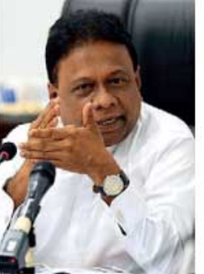
தெற்கில் உள்ள இளைஞர் பாராளுமன்ற உறுப்பினர்கள், நாடு தொடர்பில் முன்வைக்கும் கருத்துக்களையும் ஊடகங்களில் வெளிப்படுத்த வேண்டும் என்றார். இவ்வாறு ஊடகங்களில் வெளிவரும் போதுதான், பாராளுமன்றத்தில் உள்ள எங்களுக்கு பாராளுமன்றத்தில் என்ன பேச வேண்டும் என்பது தெரியும். எனவே, இளைஞர் பாராளுமன்ற விடயங்களை ஊடகங்களில் வெளியிட வேண்டும் என ஊடகங்களிடம் தான் கோரிக்கை விடுப்பதாகவும் தெரிவித்தார். இதேவேளை, இளைஞர் பாராளுமன்றம், பாராளுமன்ற உறுப்பினர்களுக்கு முன்னுதாரணமாக இருக்க வேண்டும் எனவும் தெரிவித்தார்.

இளைஞர் பாராளுமன்ற நிகழ்வுகளை ஊடகங்களில் வெளிக்கொணர வேண்டுமென வெகுசன ஊடக அமைச்சர் டாள் அழகபெரும, ஊடகங்களிடம் கோரிக்கை விடுத்துள்ளார். மாசாண சபையின் சபை அடர்வுகளில் இரு கட்சிக்காரர்கள் தாக்கிக்கொள்வதையும், பாராளுமன்றத்தின் புலி, நரி, நாய் என ஒருவரையொருவர் திட்டிவதையும் ஊடகங்கள் வெளியிடுகின்றன எனத் தெரிவித்த அவர், இவற்றையும் வெளியிட வேண்டாமென கூறப்போவதில்லை என்றார். இந்த விடயங்களை ஊடகங்களில் வெளியிடுவதுபோல இளைஞர் பாராளுமன்றத்தில் வடக்கு