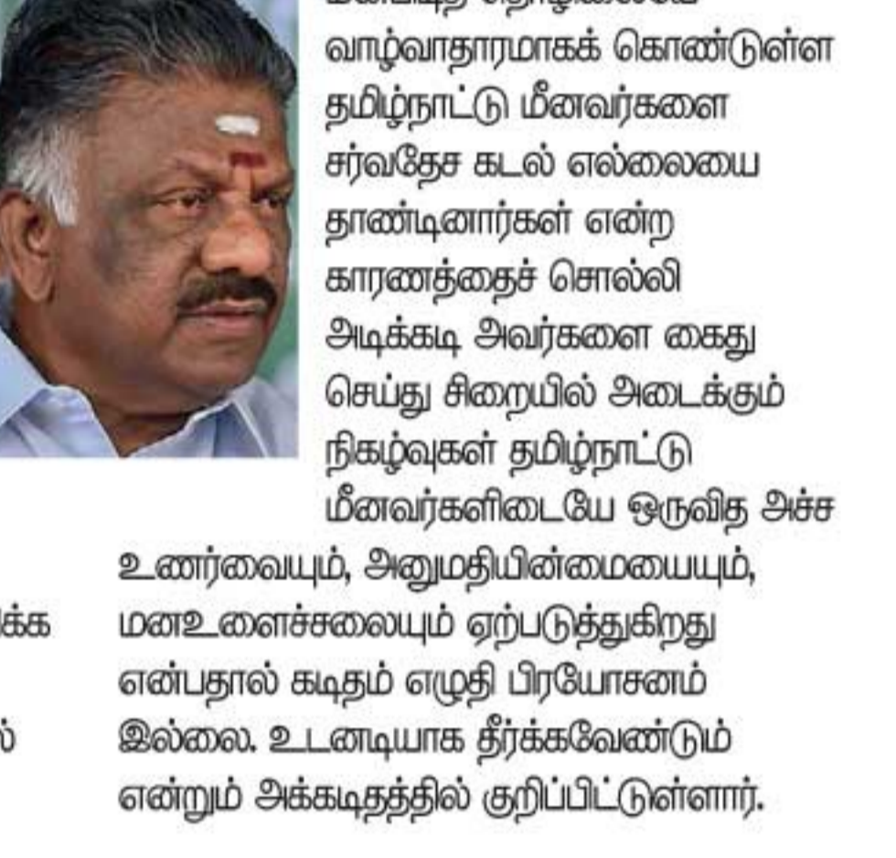
மீன்பிடித் தொழிலையே வலுவூட்டாமல் கொண்டுள்ள தமிழ்நாட்டு மீனவர்களை எவ்வகை கல் எல்லை தாண்டினார்கள் என்ற காரணத்தைச் சொல்லி அடிக்கடி அவர்களை கைது செய்து சிறையில் அடைக்கும் நடவடிக்கை தமிழ்நாட்டு மீனவர்களிடையே ஒருவீத அச்ச உணர்வையும், அழமதிப்பின்மையையும், மன உளைச்சலையும் ஏற்படுத்துகிறது என்பதால் கடிதம் எழுதி பிரச்சனை இல்லை. உடனடியாக தீர்க்கவேண்டும் என்றும் அக்கடிதத்தில் குறிப்பிட்டுள்ளார்.

மீ னவர்கள் பிரச்சனைபில் கடிதம் எழுதவது போன்று, அப்பிரச்சினைக்கு உடனடி தீர்வு காண வேண்டுமென அண்ணா திராவிட முன்னேற்ற கழகத்தின் (தி.மு.க., ஒருங்கிணைப்பாளர் ஓ. பன்னீர்செல்வம் தமிழக அரசுக்கு வலியுறுத்தியுள்ளார். தமிழ்நாட்டு மீனவர்களின் பாதுகாப்புக்கு உத்தரவாதம் அளிப்பது மற்றும் மீன்பிடி உரிமையை காப்பது ஆகியவற்றிற்கு முன்னோக்கம் அளிக்க வேண்டிய கடமையும், பொறுப்பும் மாநில அரசுக்கு இருக்கிறது என்றும் அக்கடிதத்தில் தெரிவித்துள்ளார்.