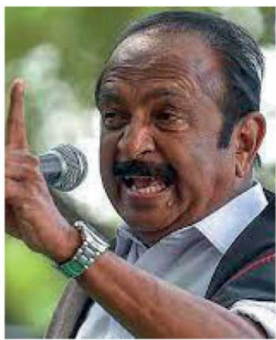
1980-களில் தொடங்கி, 40 ஆண்டுகளுக்கும் மேலாக, ஆயிரத்திற்கும் மேற்பட்ட தாக்குதல்களில், 600-க்கும்

கு ஜராத் மீனவர் ஒருவரை, பாகிஸ்தான் கடற்படை தாக்கியது என்றவுடன், புதுடெல்லியில் உள்ள பாகிஸ்தான் தூதரை, அயல் உறவுத்துறை அமைச்சுக்கு வரவழைத்து, கண்டனத்தைப் பதிவு செய்கின்ற பாரதிய ஜனதா கட்சி அரசு, தமிழக மீனவர்களைத் தாக்குகின்ற இலங்கைத் தூதரை அழைத்து எச்சரிக்கை செய்யாதது ஏன்? என மறுமலர்ச்சி திராவிட முன்னேற்ற கழகத்தின் பொதுச் செயலாளர் வைகோ கேள்வியெழுப்பியுள்ளார். தமிழ்நாட்டு மீனவர்கள் 55 பேரை, இலங்கைக்கடற்படை கைது செய்து இருக்கின்றது; அவர்களுடைய 6 மீன்பிடிப் படகுகளைப் பறிமுதல் செய்து கொண்டு போயிருக்கின்றனர்.