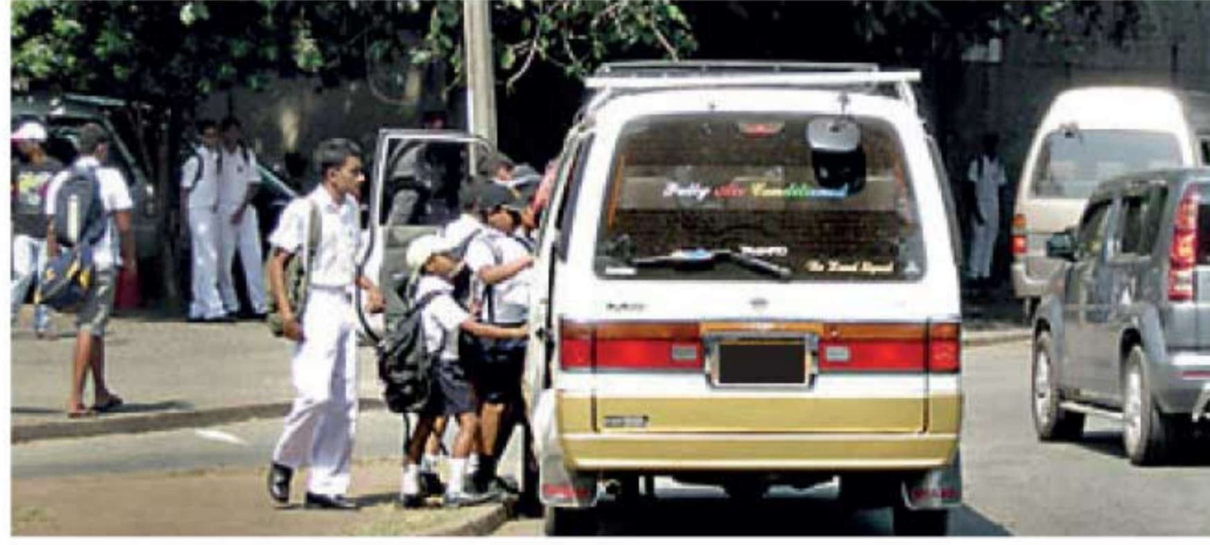
வழங்கத் தவறும் பட்சத்தில் ஜனவரி 03ஆம் திகதி முதல் பாடசாலை மாணவர்களுக்கான வான் கட்டணங்கள் 20 சதவீதத்தால் அதிகரிக்கும் எனவும் அவர் தெரிவித்தார்.

நாம் வேன் கட்டணங்களை அதிகரிக்கவில்லை. பெற்றோர்களால் இதனைத் தாங்கிக்கொள்ள முடியாது என்பதாலேயே நாம் அதிகரிக்கப்பட்ட கட்டணங்களை அதிகரிக்கவில்லை. இன்று (23) பாடசாலைகள் மூடப்பட்டு மீண்டும் ஜனவரி 03ஆம் திகதி பாடசாலைகள் திறக்கப்படவுள்ளன. எனவே, இடைப்பட்ட இந்த 10 நாளுக்குள் எங்களுக்கு நிவாரணங்கள் வழங்க வேண்டும். குறிப்பாக, கூப்பன் முறை ஒன்றையாவது அரசாங்கம் எங்களுக்காக நடைமுறைப்படுத்த வேண்டும்" என்றார். அரசாங்கம் நிவாரணங்களை