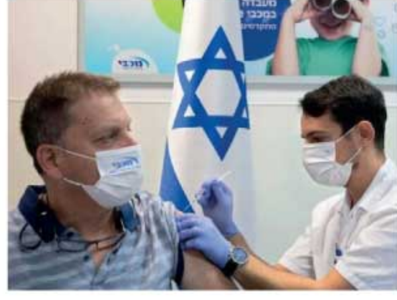
தெரிவிக்கப்பட்டுள்ளது. இஸ்ரேலில் தற்போது பெரும்பாலான மக்களுக்கு 3 ஆம்

அத்துடன் அந்நாட்டிலுள்ள மருத்துவர்கள், செவிலியர்கள் மற்றும் முன்களப் பணியாளர்களுக்கும் 4ஆம் கட்டத் தடுப்பூசியைச் செலுத்த முடிவு செய்துள்ளதாகவும்