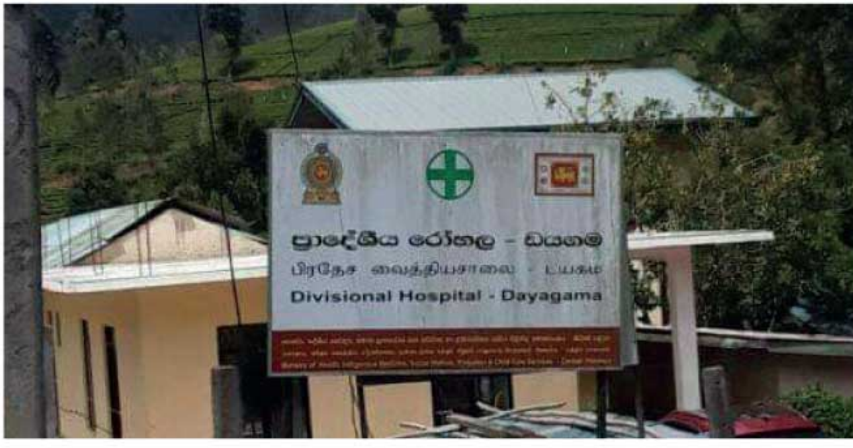
என்னும் வைத்தியசாலையின் அபிவிருத்தியை மேலும் முன்னெடுக்க போதியளவான காணி வசதிகள் இல்லாமல் இருப்பது அபிவிருத்தித் திட்டங்களை முன்னெடுப்பதற்கு பெரும் தடையாகவே இருப்பதாக சுட்டிக்காட்டுகின்றனர். அத்துடன், 5 தாதியர்கள்

■ துவாரகாள் நுவரெலியா மாவட்டத்தில் 17 தோட்டங்களைக் கொண்ட டயகம பிரதேசத்தில் 09 ஆயிரத்துக்கும் அதிகமான மக்கள் வாழ்ந்து வருகின்றனர். இம்மக்களின் சுகாதார நடவடிக்கைகளுக்காக, வெள்ளையர்களின் காலத்தில் டயகம பிரதேசத்தில் வைத்தியசாலை ஒன்று நிர்மாணிக்கப்பட்டு அதனுடாக மக்களுக்கு சுகாதார சேவைகள் வழங்கப்பட்டு வந்த நிலையில், குறித்த வைத்தியசாலையை 90ஆம் ஆண்டு காலப்பகுதியில் அரசாங்கம் பொறுப்பேற்றது. அதன்பின்னர் புதிய கட்டடம் ஒன்றும் நிர்மாணிக்கப்பட்டுக் கொடுக்கப்பட்டுள்ளது.