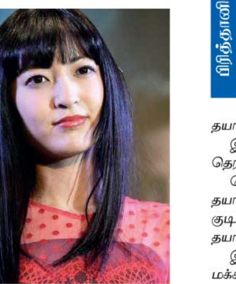
செய்திருந்த நிறுவனம் முயற்சி செய்துள்ளது.

எனினும் நீண்ட நேரமாகியும் அவர் வருகை தராததால், அவரைத் தொடர்பு கொள்ள குறித்த நிகழ்ச்சியை ஒழுங்கு