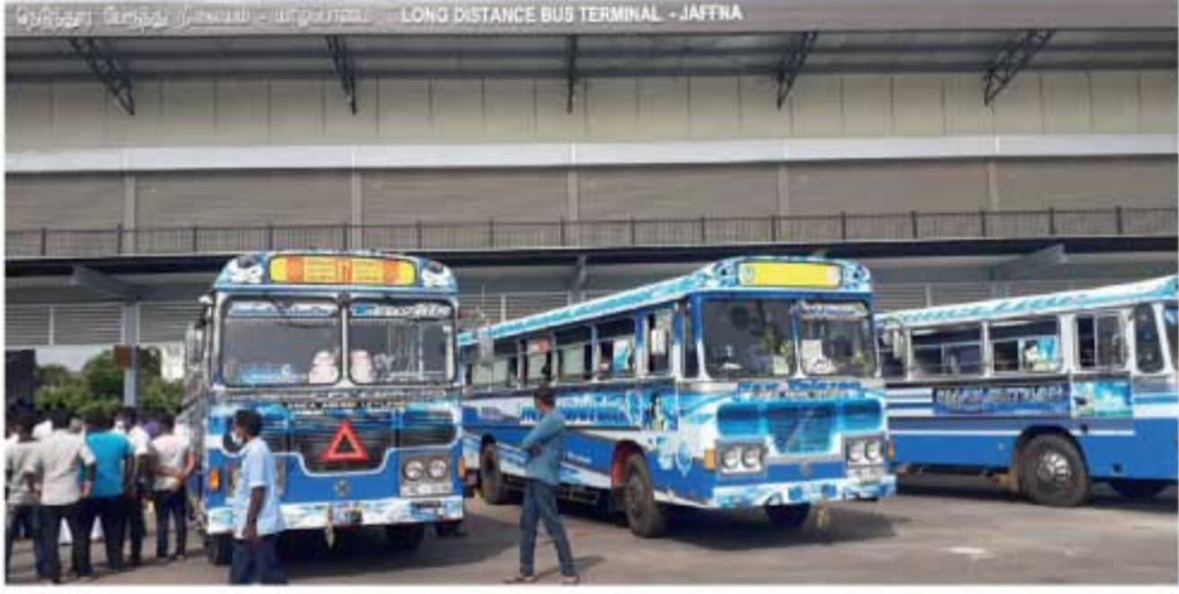
இக்கலந்துரையாலுக்கு அழைப்பு விடுக்கப்பட்டுள்ளது. பிரதான தொழிற்சங்கங்களான அகில இலங்கை தனியார் பஸ் ஊழியர்கள் சங்கம், தென் மாகாண பஸ் உரிமையாளர்கள் சங்கம் ஆகிய இரண்டுக்கும் அழைப்பு விடுக்கப்படவில்லை. பஸ் உரிமையாளர்கள் சங்கம் என்கிற வகையில்