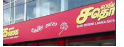
தாக அமைச்சர் தெரிவித்தார்.

2015 ஆம் ஆண்டு 190 கோடியாக இருந்த நடட்டத்தை 2021 ஆம் ஆண்டு இறுதிக்குள் 80 கோடி ரூபாவாக குறைக்க லங்கா சதொச நடவடிக்கை எடுத்துள்ள