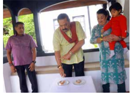
குறித்த சந்தர்ப்பத்தில் பிரதமர், பிரதமரின் பாரியார் மற்றும் இராணுவத்தினர், பொலிஸார் உள்ளிட்ட பாதுகாப்புப் பிரிவின் உறுப்பினர்கள் பலரும் கலந்துகொண்டனர்.

சுனாமி அனர்த்தம் உள்ளிட்ட பல்வேறு அனர்த்தங்களில் உயிரிழந்தவர்களை நினைவுகூரும் 'தேசிய பாதுகாப்பு தினம்' நேற்றைய தினத்தில் அனுஷ்டிக்கப்பட்டது.