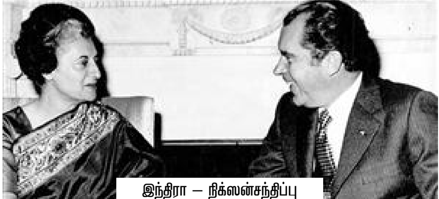
இந்திரா - நீக்ஸன் சந்திப்பு

அந்தப் பின்னணியில் தமிழர் விடுதலைக் கூட்டணி ஆயுதப்போராட்ட விடுதலைக் குழுக்களையும் உள்ளடக்கிய பேச்சுகளின் மேல் தான் 1987இல் வான் பரப்பில் அத்துமீறி உள்ளிட்ட தண்டத்தின் பின், ஒப்பந்தத்தில் வேறுவழியின்றி ஜே.ஆர். கைச்சாத்து வைத்தார். (வளரும்)