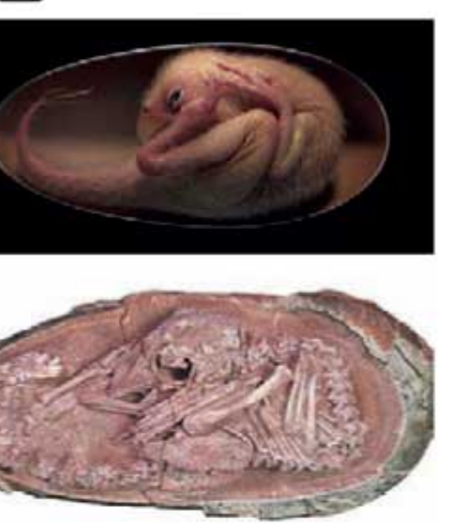
பறவைகளுடன் நெருங்கிய தொடர்பு கொண்டவை என்றும் நம்பப்படுகின்றமை குறிப்பிடத்தக்கது.

சீ னாவின் காஞ்ச்சோ (Ganzhou) பகுதியில் கரு உருமாறாத முட்டையொன்றை தொல்பொருள் ஆராய்ச்சியாளர்கள் கண்டுபிடித்துள்ளனர். இம் முட்டையானது குறைந்தது 66 மில்லியன் ஆண்டுகளுக்கு முன்பிலிருந்தே அங்கு இருந்திருக்கலாம் என்றும் இருகுகள் கொண்ட டைனோசர் வகையிலிருந்து இம் முட்டை வந்திருக்கலாம் என்றும் கூறப்படுகின்றது. மேலும் இத்தகைய டைனோசர்கள், இக்காலப்