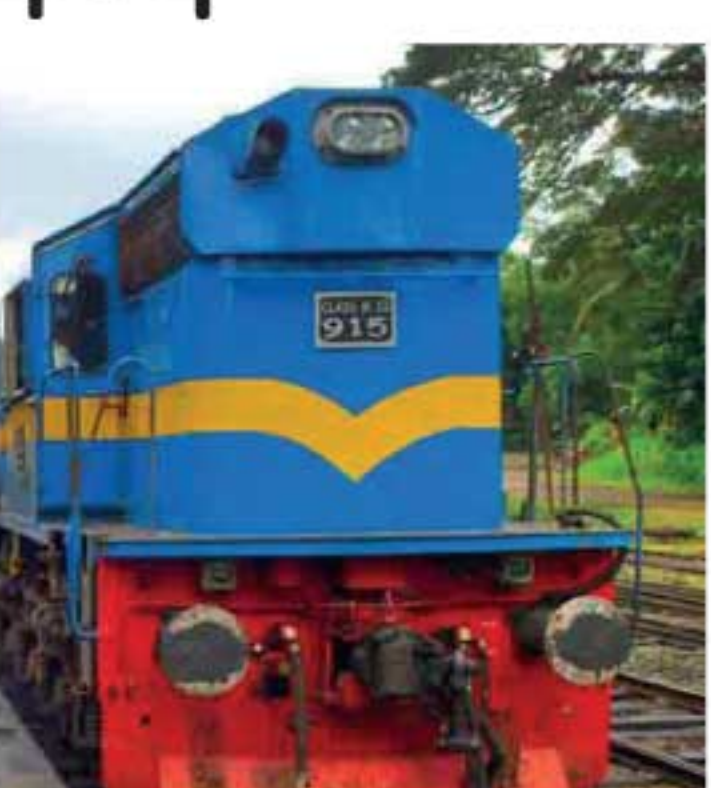
அடுத்தக்கட்ட தீர்மானத்தை அறிவிக்கவுள்ளதாகவும் அச்சங்கம் அறிவித்துள்ளது.

ரயில்வே நிலைய அதிபர் சங்கம், நேற்று (26) நள்ளிரவு முதல் நாடளாவிய ரீதியில் வேலைநிறுத்தப் போராட்டத்தில் குதிக்க தீர்மானித்திருந்தது. அந்த தீர்மானத்தை இன்று (27) காலை 10 மணிவரைக்கும் ஒத்திவைத்துள்ளதாக அச்சங்கம் அறிவித்துள்ளது. தமது கோரிக்கைகள் தொடர்பில் இன்றையதினம் பேச்சுவார்த்தை நடத்தப்படவுள்ளதாகவும் அதன்பின்னரே