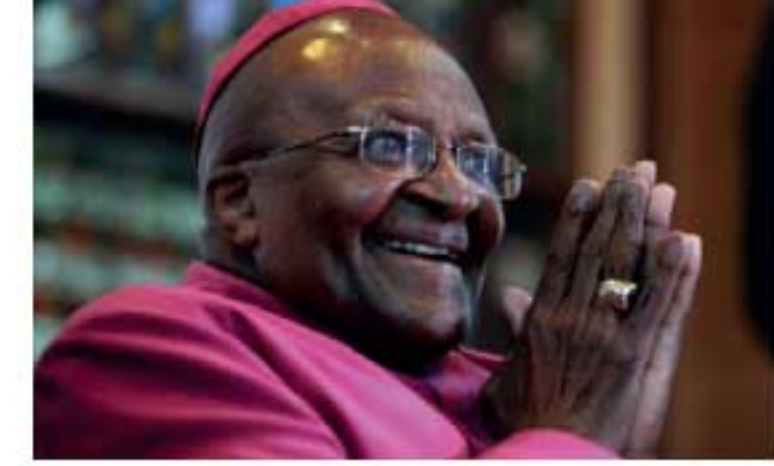
டூட்டு அயராது உழைத்தவர் என தமிழ்த் தேசிய கூட்டமைப்பு விடுத்துள்ள இரங்கல் செய்தியில் குறிப்பிடப்பட்டுள்ளது.

நித்திய இளைப்பாறிய பேராயர் டெஸ்மண்ட் டூட்டுவின் மறைவிற்கு தமிழ்த் தேசிய கூட்டமைப்பு இரங்கல் தெரிவித்துள்ளது. தென்னாபிரிக்காவில் இனவாதத்திற்கு எதிராகவும் உலகில் அனைத்து அநீதிகளுக்கு எதிராகவும் போராடியவர் மட்டுமல்லாது சமாதானத்திற்கும் நல்லணக்கத்திற்குமாகவும் பேராயர் டெஸ்மண்ட்