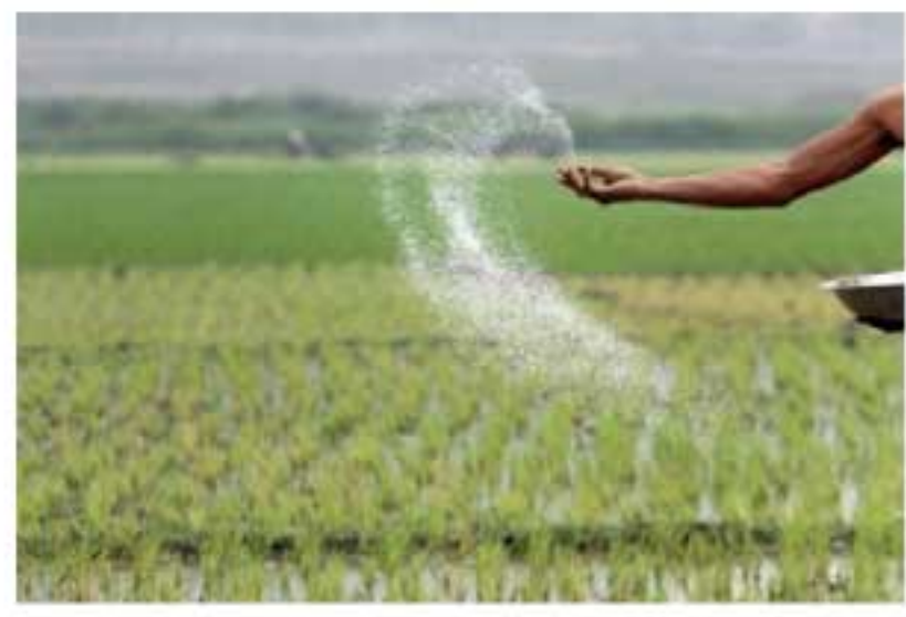
இயற்கை உரங்களில் எவ்வித பயனையும் பெறாமல், அதனை பகிரங்கமாக விணாக்குபவர்களுக்கு எதிராக நடவடிக்கை எடுக்குமாறு சம்பந்தப்பட்ட பிரிவுகளுக்கு அறிவுறுத்த எதிர்பார்ப்பதாகவும் அவர் தெரிவித்துள்ளார்.