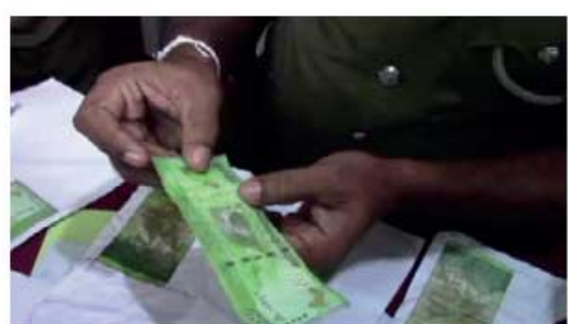
வைத்துக்கொள்ள நடவடிக்கை எடுக்குமாறு மத்திய வங்கி தெரிவித்துள்ளது.

நாடு முழுவதும் போலி நாணயத்தாள்கள் அதிகளவில் புழக்கத்தில் உள்ளதால், பொதுமக்கள் மிகவும் அவதானமாக இருக்குமாறு இலங்கை மத்திய வங்கி அறிவுறுத்தியுள்ளது. சந்தேகத்துக்கு இடமான நாணயத்தாள்கள் ஒன்று காணப்பட்டால் பாதுகாப்புச் சின்னம் தொடர்பில் ஆராய்ந்த பின்னர் அதைத் தம்வசம்