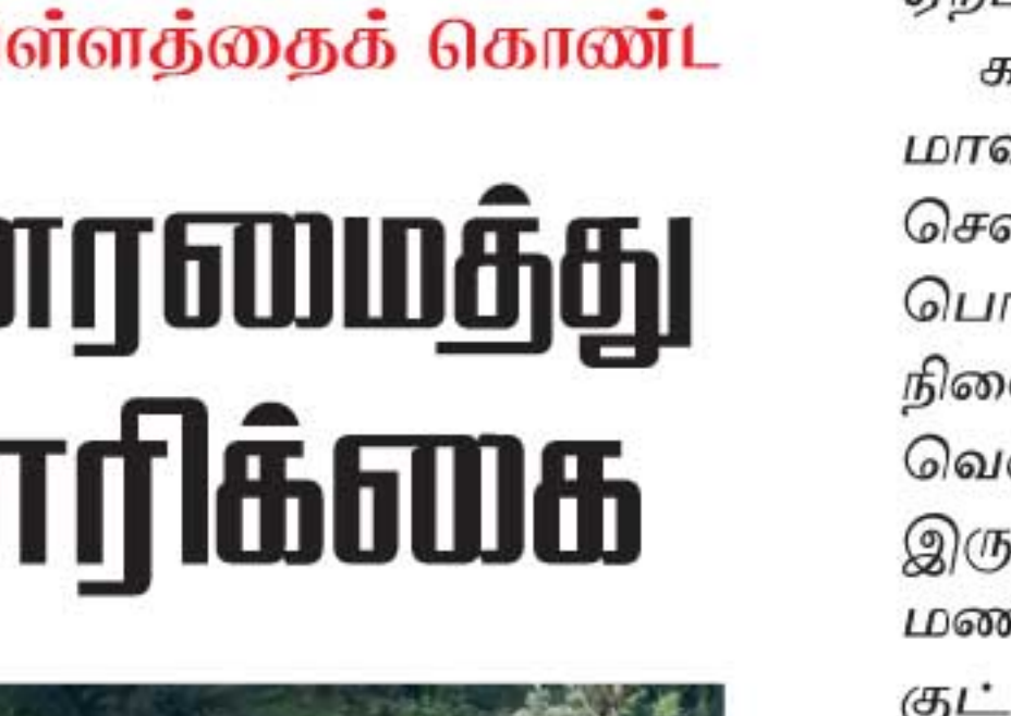
என்பதுடன், வாடகைக்கு வாகனங்களை அழைத்தால் கூட, பாதையின் மோசமான நிலைமையின் காரணமாக, வாகன சாரதிகள் வருவதற்கு அச்சப்படுகின்றனர்.

மவுசாக்கலை தோட்டம், பசறை - நமுனுகுலை பிரதான வீதியில் இருந்து சுமார் 500 அடிக்கும் மேலான மலைப்பகுதியில் அமைந்துள்ளது. இத்தோட்டத்துக்குச் செல்லும் பிரதான வீதி, மிகவும் சேதமடைந்த நிலையில், எவ்வித வாகனங்களும் பயணிக்க முடியாத நிலையில் காணப்படுகின்றது.