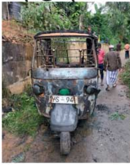
இதனையடுத்து அயலவர்களால் தீயை அணைக்க எடுத்த முயற்சிகள் தோல்வியடைந்ததுடன், ஓட்டோ முற்றாக எரிந்து சேதமடைந்துள்ளது. இது தொடர்பான மேலதிக விசாரணைகளை பசறை பொலிலார் முன்னெடுத்து வருகின்றனர்.