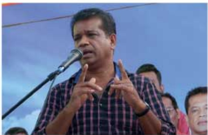
சக்தியின் பின்னால் மக்கள் அணிதிரண்டு வருகின்றனர். இவ்வாறான நிலையில் தேசிய மக்கள் சக்தியும் இந்தக் கட்சிகளுடன் சென்று கூட்டணி வைத்தால், மக்களுக்கு வேறு

இது தொடர்பில் மேலும் தெரிவித்த அவர், ஸ்ரீ லங்கா பொதுஜன பெரமுன, ஸ்ரீ லங்கா சுதந்திரக் கட்சி, ஐக்கிய தேசிய கட்சி, ஐக்கிய மக்கள் சக்தி ஆகிய கட்சிகள் மீது மக்கள் நம்பிக்கை இழந்துள்ளதாலேயே, தேசிய மக்கள்