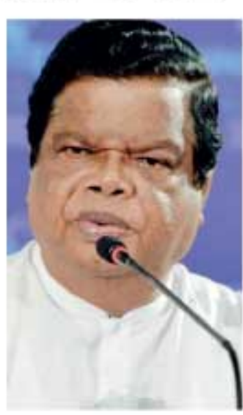
காரணம். துறைமுகங்கள், விமான நிலையங்களை மூடுவது என்பது உற்பத்திகளின் வீழ்ச்சியையே குறிக்கும் எனவும் தெரிவித்தார்.

தட்டுப்பாடுகளுக்கு உற்பத்தி குறைந்துள்ளமையே காரணமாகும். எனவே, தட்டுப்பாடுகளை நீக்குவதற்கு உற்பத்திகளில் விரைவாக ஈடுபடுவதே தீர்வாக அமையும். எனவே, உற்பத்திகளை அதிகரிக்க வேண்டும். உற்பத்தி வேலைத்திட்டங்களில் ஜனாதிபதியால் ஈடுபட்ட முடியாதுபோனமைக்கு கொரோனா வைரலே காரணம். துறைமுகங்கள், விமான நிலையங்களை மூடுவது என்பது உற்பத்திகளின் வீழ்ச்சியையே குறிக்கும் எனவும் தெரிவித்தார்.