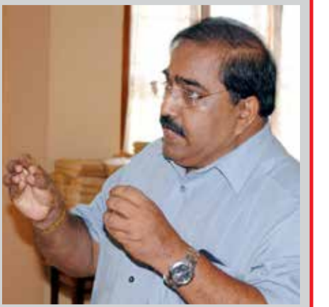
கிக் கொள்ள வேண்டுமே தவிர, தரகுப் பணம் வருகிறதே என்பதற்காக நாட்டை வல்லரசுகளிடம் விற்றுவிடக்கூடாது.

இலங்கையின் பொருளாதார வளர்ச்சிக்கு மிகவும் தடையாக இருக்கக்கூடிய முப்படைகளின் அதிகரிப்பை நிறுத்துவதுடன் அவற்றை இயன்றவரை எவ்வாறு குறைக்கலாம் என்பது பற்றியும் சிந்திக்க வேண்டும். இலங்கையின் வெளிவிவகாரக் கொள்கைகளை நாட்டு நலனுக்கேற்பவும், நாட்டின் பொருளாதார வளர்ச்சிக்கு ஏற்றவகையிலும் உருவாக்கிக் கொள்ள வேண்டுமே தவிர, தரகுப் பணம் வருகிறதே என்பதற்காக நாட்டை வல்லரசுகளிடம் விற்றுவிடக்கூடாது.