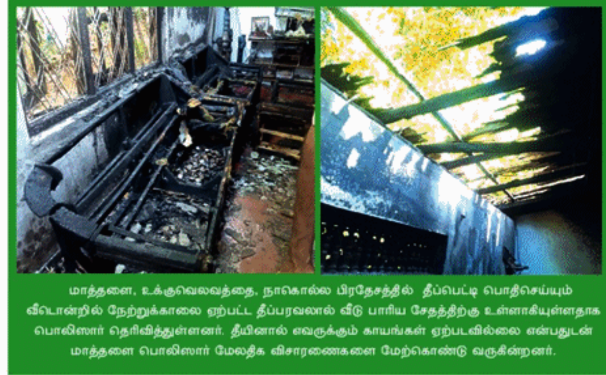
மாத்தளன், உக்குவலவத்தை, நாகொல்ல பிரதேசத்தில் தீப்பெட்டி பொறிசெய்யும் வீடொன்றில் நேற்றுக்காலை ஏற்பட்ட தீப்பரவலால் வீடு பாரிய சேதத்திற்கு உள்ளாகியுள்ளதாக பொலிஸார் தெரிவித்துள்ளனர். தீயினால் எவருக்கும் காயங்கள் ஏற்படவில்லை என்பதுடன் மாத்தளன் பொலிஸார் மேலதிக விசாரணைகளை மேற்கொண்டு வருகின்றனர்.

முல்லைத்தீவு மாவட்டத்தின் புதுமாத்தளன் கடற்கரைப் பகுதியில் மண்ணுள் புதைபட்ட உழவு இயந்திரத்தின் பாகங்கள் சில மீனவர்களால் இனங்காணப்பட்டுள்ளன. தற்போது முல்லைத்தீவு மாவட்டத்தில் கடல் சீற்றம் அதிகமாக காணப்படும் நிலையில், கடற்கரையில் அலையின் தாக்கம் அதிகமாக காணப்படுகின்றது. இந்நிலையில், நேற்றுமுன்தினம் நிலையில், கடற்கரையில் அலையின் தாக்கம் அதிகமாக காணப்படுகின்றது. இந்நிலையில், நேற்றுமுன்தினம் (08) காலை புதுமாத்தளன் கடற்கரைப் பகுதியில் கடந்த காலத்தில் புதைக்கப்பட்ட அல்லது கடலில் அள்ளி எடுக்கப்பட்டு உழவு இயந்திரத்தின் பாகங்கள் சில கரையில் அடையாளம் காணப்பட்டுள்ளன. உழவு இயந்திரத்தின் பெரிய ரயர்கள் உள்ளிட்ட பாகங்கள் கடற்கரையில் தென்பட்டுள்ளதுடன், இரும்புத் தண்டுகளும் இனங்காணப்பட்டுள்ளன. 2009ஆம் ஆண்டு போரின் இறுதி நாட்களில் மக்களால் கைவிடப்பட்ட உழவு இயந்திரத்தின் பாகங்களாக இருக்கலாம் என மக்கள் தெரிவித்துள்ளார்கள். சம்பவம் தொடர்பில் முல்லைத்தீவு பொலிஸாருக்குத் தகவல் வழங்கப்பட்டுள்ளதைத் தொடர்ந்து முல்லைத்தீவு பொலிஸார் குறித்த பகுதிக்குச் சென்று பார்வையிட்டிருக்கின்றதுடன், உழவு இயந்திரத்தின் பாகங்களை நீதிமன்ற உத்தரவிற்கமைய தோண்டிப் பார்ப்பதற்கான நடவடிக்கைகள் முன்னெடுக்கப்பட்டுள்ளதாகவும் தெரிவித்துள்ளனர்.