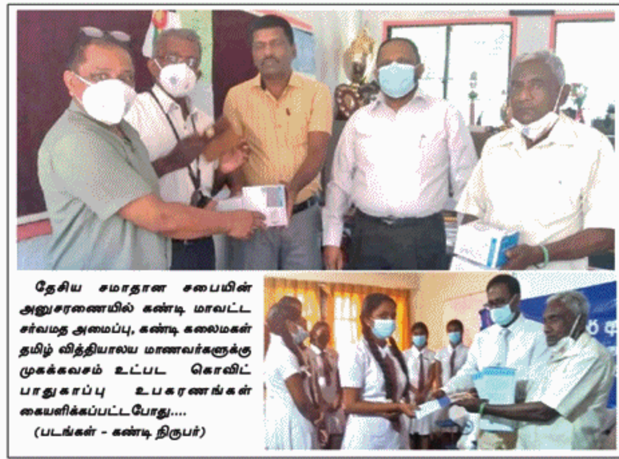
தேசிய சமாதான சபையின் அனுசரணையில் கண்டி மாவட்ட சர்வமத அமைப்பு, கண்டி கலைமகன் தயிம் வித்தியாலய மாணவர்களுக்கு முகக்கவசம் உட்பட கொவிட் பாதுகாப்பு உபகரணங்கள் கையளிக்கப்பட்டபோது...

(கண்டி திருபர்) மத்திய மாகாணத்தில் கடந்த வருடம் ஆயிரத்து 117 டெங்கு நோயாளர்கள் இனங்காணப்பட்டுள்ளதாக மாகாண கூரதாரத் திணைக்களம் நேற்று (09) தெரிவித்தது. கண்டி, மாத்தளை, நுவரெலியா ஆகிய மாவட்டங்களைச் சேர்ந்த ஆயிரத்து 117 பேருக்கு இவ்வாறு டெங்கு உறுதிப்படுத்தப்பட்டுள்ளது. அதில் கண்டி மாவட்டத்தில் ஜனவரி மாதத்தில் 67 பேரும், பெப்ரவரி மாதத்தில் 48 பேரும், மார்ச் மாதம் 51 பேரும், ஏப்ரல் மாதம் 90 பேரும், மே மாதம் 37 பேரும், ஜூன் மாதம் 40 பேரும், ஜூலை மாதம் 129 பேரும், ஒகஸ்ட் மாதம் 68 பேரும், செப்டெம்பர் மாதம் 32 பேரும், ஒக்டோபர் மாதம் 102 பேரும், நவம்பர் மாதம் 131 பேரும், டிசம்பர் மாதம் 36 பேருமாக பதிவாளர்களும் மொத்தம் 830 பேர் இனங்காணப்பட்டதாகவும் தெரிவிக்கப்பட்டது. இதேவேளை, மாத்தளை மாவட்டத்தில் மொத்தமாக 228 பேர் இனங்காணப்பட்டதாக தெரிவிக்கப்பட்டுள்ளது. நுவரெலியா மாவட்டத்தில் 59 பேருக்கு டெங்கு நோயாளர்களை அடையாளம் காணப்பட்டுள்ளனர். 2020ஆம் ஆண்டுடன் ஒப்பிடும்போது வருட ஆரம்பத்தில் டெங்கு நோயால் பாதிக்கப்பட்டவர்கள் தொகை குறைவாக இருந்தபோதும் வருட இறுதியில் நோயாளர்களின் எண்ணிக்கை அதிகரிப்பு ஏற்பட்டதாக திணைக்களம் மேலும் குறிப்பிட்டது.