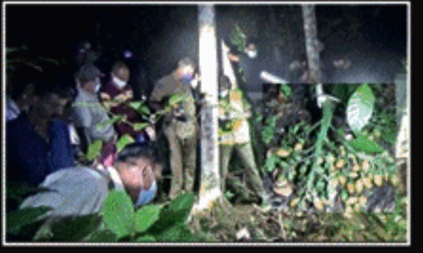
தேடியபோதே அன்று இரவு பாக்கு மரத்துக்கு கீழே சடலமாக மீட்கப்பட்டுள்ளார்.

(கம்பளை திருபர்) கம்பளை பொலிஸ் பிரிவுக்குட்பட்ட உடுவரல்ல, புவக்கொட்டுவ தோட்டத்தில் நேற்று முன்தினம் இரவு ஆணொருவரின் சடலம் மீட்கப்பட்டுள்ளது. நேற்று முன்தினம் காலை ஆறு மணியளவில் வீட்டிலிருந்து புறப்பட்ட குறித்த நபர், பாக்கு பறிப்பதற்காக தோட்டத்திற்கு சென்றுள்ளார். இந்நிலையில், இரவு வரை வீடு திறம்பாத காரணத்தினால் அவரின் குடும்பத்தார் அவரை தேடிவந்தனர். இந்த நபர் பாக்கு மரத்திலிருந்து கீழே இறங்கும்போது தவறுதலாக விழுந்து உயிரிழந்திருக்கலாம் என பொலிஸார் சந்தேகம் வெளியிட்டுள்ளனர். 58 வயதான இந்த நபர் மூன்று பிள்ளைகளின் தந்தை. இவருடைய சடலம் மரண பரிசோதனைக்காக கம்பளை ஆதார வைத்தியசாலைக்கு கொண்டு செல்லப்பட்டுள்ளது. இதுதொடர்பான மேலதிக விசாரணைகளை கம்பளை பொலிஸார் மேற்கொண்டு வருகின்றனர்.