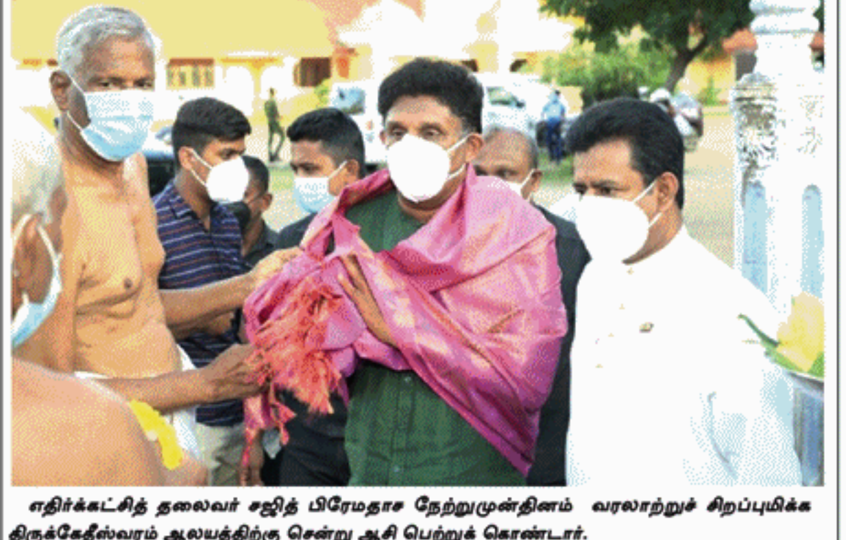
எதிர்க்கட்சித் தலைவர் சஜித் பிரேமதாச நேற்றுமுன்தினம் வரலாற்றுச் சிறப்புமிக்க திருக்கேதீஸ்வரம் ஆலயத்திற்கு சென்று ஆசி பெற்றுக் கொண்டார்.