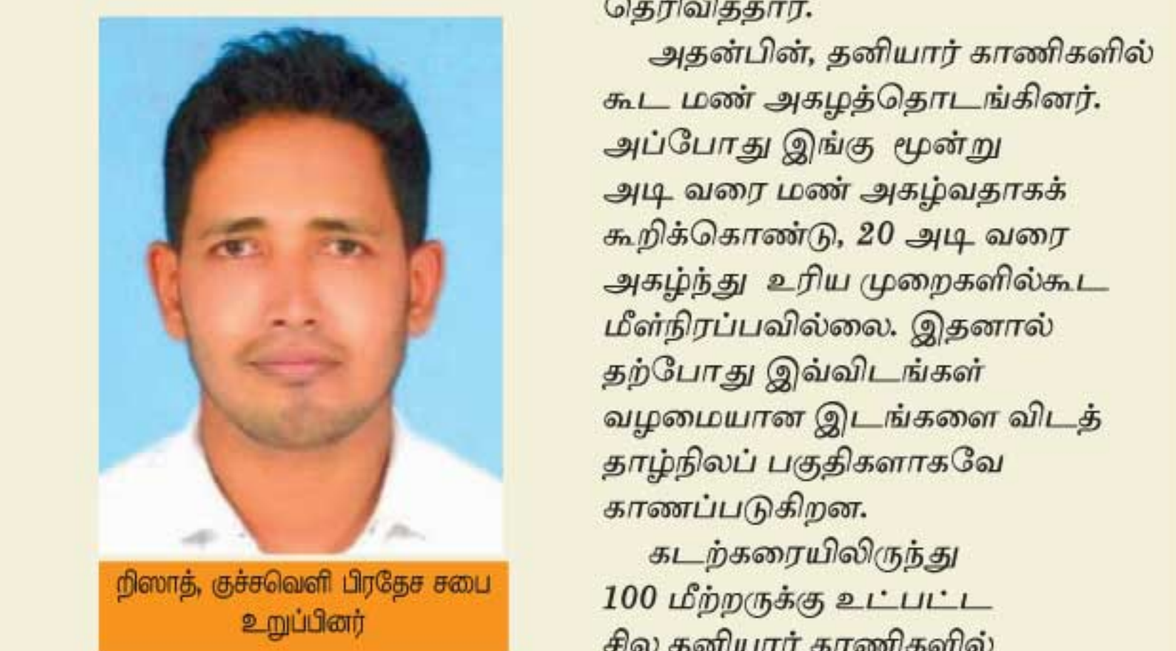
நிலாத் குச்சுவெளி பிரதேச சபை உறுப்பினர்

என்பன இரண்டும் சங்கமித்து, புடவைக்கட்டு கழிமுகம் உருவாகி உள்ளது. இதன் பரப்பளவு 145 ஹெக்டேயர் ஆகும். புடவைக்கட்டுப் பாலம் 2008இல் அமைக்கப்படும் வரையும் இங்கு போக்குவரத்துப் பாதை ஒன்று சேவையில் இருந்தது. பருவப் பெயர்ச்சி மழைக்காலத்தில் இதில் மண்ணரிப்பு அதிகமாக உள்ளதாக மக்கள் குறிப்பிடுகின்றனர்.