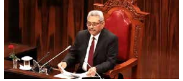
ஒத்திவைப்பு வேளை பிரேரணை எதிரணியால் முன்வைக்கப்படவுள்ளது.