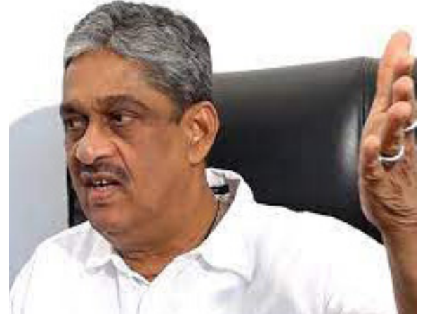
எங்களிடம் ஆலோசனைகளைக் கேட்டா செயற்பட்டார் எனவும் அவர் இதன்போது வினவியுள்ளார்.

மத்திய வங்கியின் பிணை முறிமோசடி இடம்பெறும் போது அப்போதைய பிரதமர் ரணில் விக்கிரமசிங்க