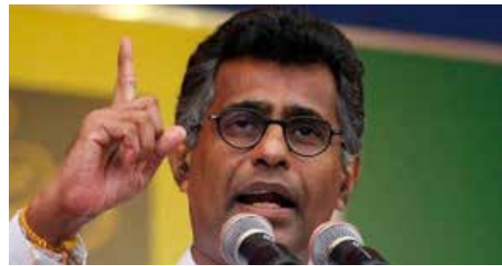
இலங்கை மின்சாரத்துறை பாரிய நெருக்கடியை நோக்கிச் செல்லும் என ஐக்கிய மக்கள் சக்தி கட்சியின் நாடாளுமன்ற உறுப்பினர் பாட்டலி சம்பிக்க ரணவக்க

எச்சரித்துள்ளார். அடுத்த மாத இறுதிக்குள் இந்த நிலைமை ஏற்படும் என அவர் குறிப்பிட்டுள்ளார்.