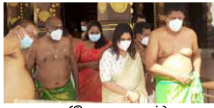
எதிர்க்கட்சித் தலைவரும் ஐக்கிய மக்கள் சக்தியின் தலைவருமான சஜித் பிரேமதாஸ் நேற்று காலை வரலாற்றுச் சிறப்பு

அரசு நிறுவனங்களின்... (முதலாம் பக்கத் தொடர்ச்சி) நீதி அமைச்சர் பனில் ராஜபக்ஷ அமைச்சரவை அந்தஸ்துள்ள அனைத்து அமைச்சர்களுக்கும் அறிவித்துள்ளார் என்று அரசு வட்டாரங்கள் தெரிவிக்கின்றன. வரவு - செலவுத் திட்டத்தில் முன்மொழியப்பட்டுள்ள அரசின் செலவுகளை முகாமெத்துவப்படுத்தும் மட்டுப்படுத்தல்களுக்கு மேலதிகமாக இவ்வாறு அரசு நிறுவனங்களின் செலவுகளைக் குறைத்துக்கொள்ள மாறு அவர் கேட்டுக்கொண்டுள்ளார். அமைச்சரவைப் பத்திரம் ஒன்றைச் சமர்ப்பித்து அதன்மூலம் நீதி அமைச்சர் இந்த வேண்டுகோளை விடுத்துள்ளார் எனவும் அந்த வட்டாரங்கள் தெரிவித்தன. நாட்டின் பொருளாதார நெருக்கடியைக் கவனத்தில் கொண்டு செலவினங்களைக் குறைப்பதற்கான பல்வேறு நடவடிக்கைகளை அரசு முன்னெடுத்துவரும் நிலையில் நீதி அமைச்சர் பனில் ராஜபக்ஷ அமைச்சரவைப் பத்திரம் மூலம் இந்த வேண்டுகோளை விடுத்துள்ளார் எனவும் அந்த வட்டாரங்கள் மேலும் குறிப்பிட்டன.