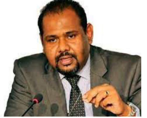
அனைத்தும் உள்ளான என தெரிவித்துள்ளார்.

அதுபோல இன்று இந்த அரசாங்கம் மூன்றில் இரண்டு பெரும்பான்மை தங்களுக்கு இருக்கின்றது எனக் கொக்கரித்துக்கொண்டு இருந்து உள்ளூராட்சித் தேர்தல்களில் முகங்கொடுக்க முடியாத அளவுக்கு அல்லது மாகாண சபை முறைமைக்கு முகங்கொடுக்க முடியாத நிலையிலே, அனைத்து தேர்தல்களையும் பிற்போடுகின்ற வகையிலேதான் அவர்களது செயற்பாடுகள்