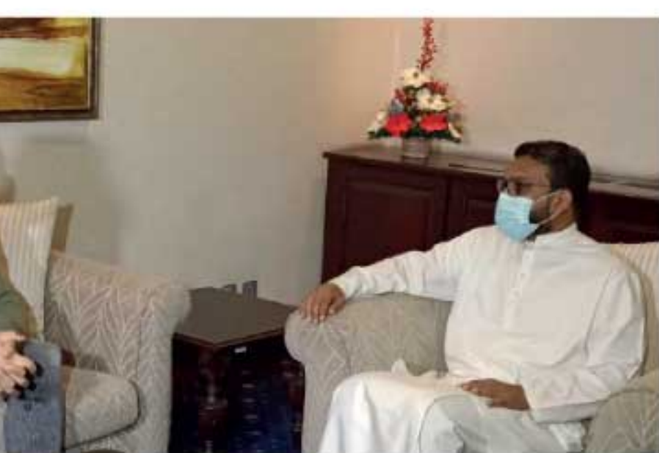
ஊடாக நேற்று (12) அதிகாலை 4.42 மணிக்கு விமான நிலையத்தை வந்தடைந்த அவர்களை, இராஜாங்க அமைச்சர் தாரக பாலாசுரிய வரவேற்றார். தங்களுடைய விஜயத்தை முடித்துக்கொண்டு, தூதுக்குழுவினர் நேற்று (12) மாலை 4.30க்கு நாட்டை விட்டு புறப்பட்டுச் சென்றனர்.

ஹங்கேரி நாட்டின் வெளிநாட்டு அமைச்சர் Peter Szijjarto நேற்று (12) காலை, கட்நூயக்க சர்வதேச விமான நிலையத்தின் ஊடாக நாட்டை வந்தடைந்தார். அவருடன் 20 பேரடங்கிய தூதுக்குழுவும் வருகைதந்துள்ளது. அங்குள்ள ஒரு நாள் விஜயத்தை மேற்கொண்டு இலங்கைக்கு வந்துள்ளனர். ஹங்கேரிக்கு உரித்துமைய WZZ -504 எனும் விமானத்தின்