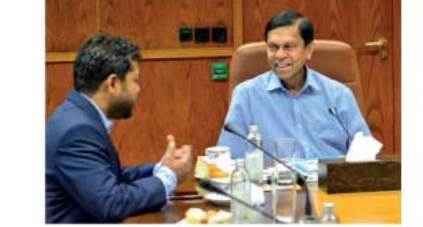
திணைக்களத்தில் நேற்று (12) இடம்பெற்ற ஊடகவியலாளர் சந்திப்பின் போதே அவர் மேற்குறிப்பிட்ட விடயத்தைத் தெரிவித்தார். தொடர்ச்சி P2

மத்திய வங்கி ஆளுநர் அறிவிப்பு நாட்டின் கடன் மறுசீரமைப்பு நோக்கங்களுக்கான தேவை ஏற்படும் பட்சத்தில், சீனாவிடமிருந்து புதிய கடனைக் கோரியுள்ளதாக மத்திய வங்கியின் ஆளுநர் அஜித் நிவார்ட் கப்ரால் தெரிவித்தார். அரசாங்க தகவல்