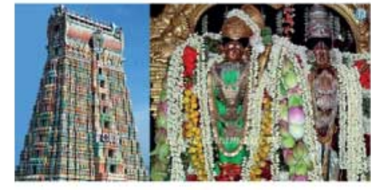
திறக்கப்படுவதை ஒட்டி கோவில் நிர்வாகம் இந்த உத்தரவை பிறப்பித்துள்ளது.

ஸ்ரீவில்லிபுத்தூர் ஆண்டாள் கோவிலில் இன்று (13) காலை 4 மணி முதல் 8 மணி வரை பக்தர்களுக்கு அனுமதி இல்லை என தெரிவிக்கப்பட்டிருக்கிறது. ஆண்டாள் கோவிலில் இன்று காலை 7.35 மணிக்கு சொர்க்கவாசல்