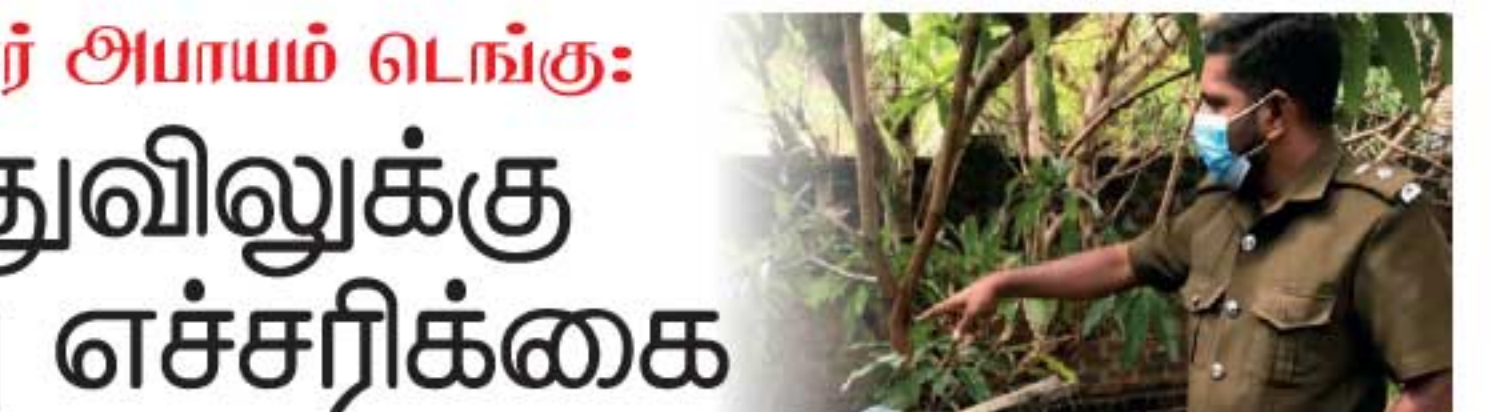
பொத்துவில் பிரதேசத்தில் 12 நாட்களுக்குள் 54 பேர் டெங்கு நோயாளர்களாக இனங்காணப்பட்டு உள்ளதையடுத்து, தொடர்ச்சி P2