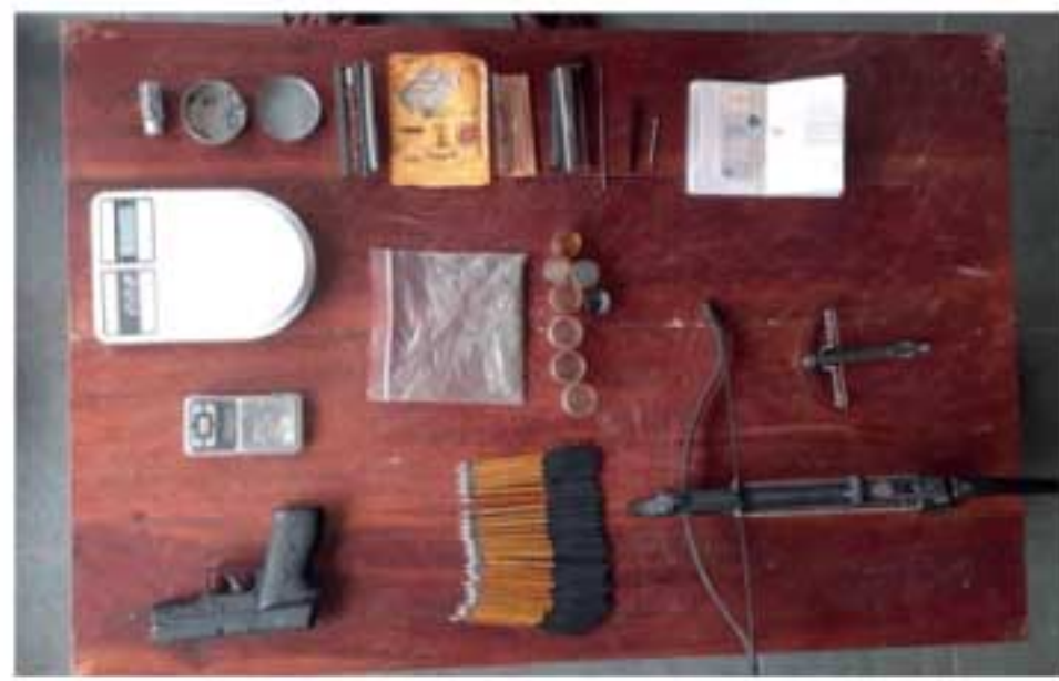
அம்புகள் 21, சிறிய வில் ஆகியனவும் கைப்பற்றப்பட்டுள்ளன. மேலே குறிப்பிட்ட பொருட்களை சந்தேகநபரான சிங்கப்பூர் பிரஜை, ஏன்? வைத்திருந்தார் என்பது தொடர்பிலான விசாரணைகளை முன்னெடுப்பதற்காக அவர், தலங்கம பொலிஸில் ஒப்படைக்கப்பட்டுள்ளார்.

ஹாஷ் எண்ணெய் போதைப்பொருள், கேரள கஞ்சா 50 கிராம், ஹாஷ் எண்ணெய் தடவப்பட்ட பிளாஸ்டிக் குப்பிகள் மூன்று, மின்னணு தராக, கஞ்சா புகையை இழுக்கும் இரண்டு உபகரணங்கள், ஜேர்மனியில் உற்பத்தி செய்யப்பட்ட குவிநாசி என்ஜைக்கப்படும் வாயு பில்லட், இரும்பு தட்டுகள், சுறுப்பு நிறத்திலான வில், அந்த விலலுக்கு பயன்படுத்தப்படும்