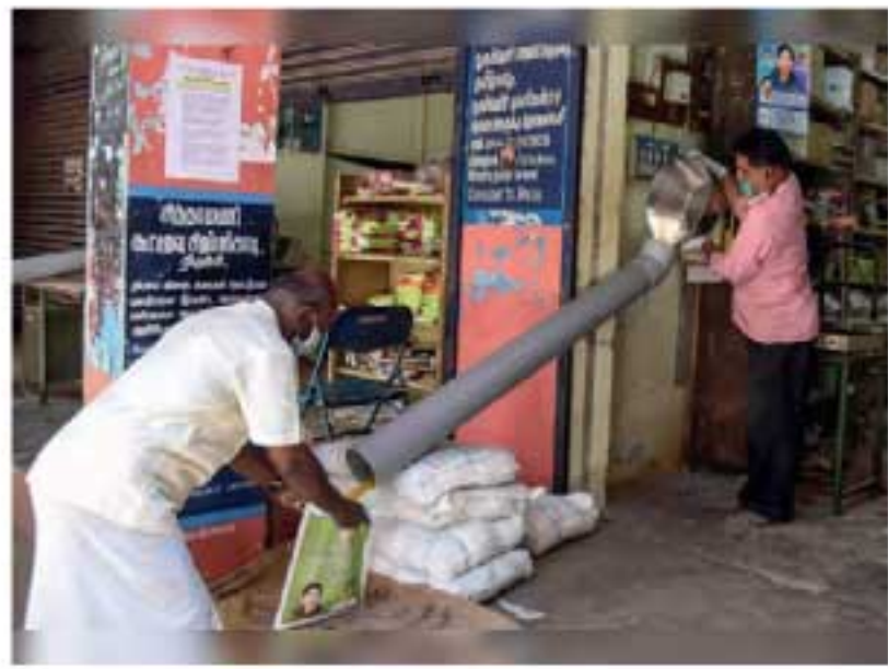
அதன்படி, சுமார் 2.15 கோடி அரிசி குடும்ப அட்டைதாரர்கள், இலங்கை தமிழர் மறுவாழ்வு

கு டும்ப அட்டைதாரர்களுக்கு ரேஷன் கடைகளில், அத்தியாவசியப் பொருட்கள் வழங்கப்படுகின்றன. இதற்கான உத்தரவை தமிழக அரசு பிறப்பித்திருந்தது. தைப்பொங்கல் பண்டிகையை பொதுமக்கள் வெகுவிரிசையாகக் கொண்டாடும் நேரத்தில், ரேஷன் கடைகள் மூலம் 21 பொருட்கள் இலவசமாக வழங்கப்படும் என, தமிழக முதலமைச்சர் மு.க. ஸ்டாலின் அறிவித்தார்.