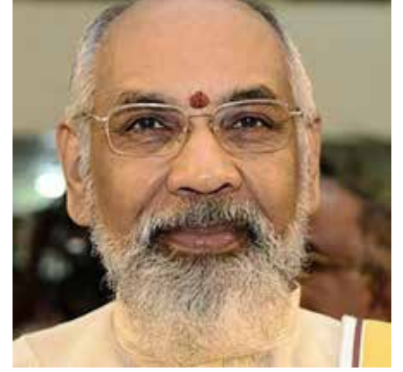
கிடைக்க வேண்டும் என்று பிரார்த்தித்து சூரியனுக்கு பொங்கல் இட்டு அவன் அருளை நாடி நிற்போம் நம்பிக்கையுடன். பொங்கலோ பொங்கல்! - என்று உள் எது.

நம்பிக்கையிலேயே உலகம் சென்று கொண்டிருக்கின்றது. இந்த வருடம் தமிழர்களுக்கு சகல செளபாக்கியங்களும்